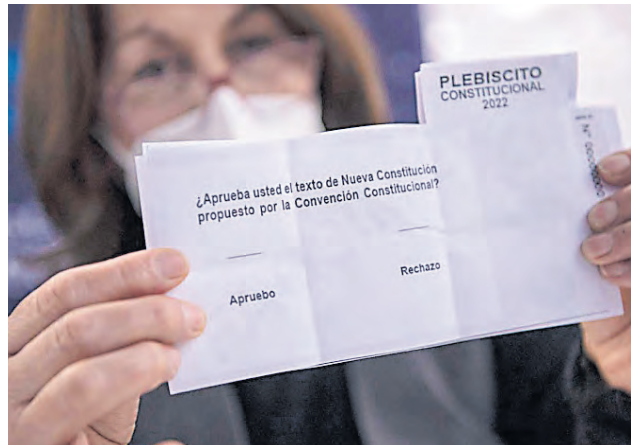
Un momento histórico en la vida política de Chile.

El mandatario chileno se refirió a las recientes protestas y episodios de violencia en el país. Dijo que quienes tomen ese camino no solo