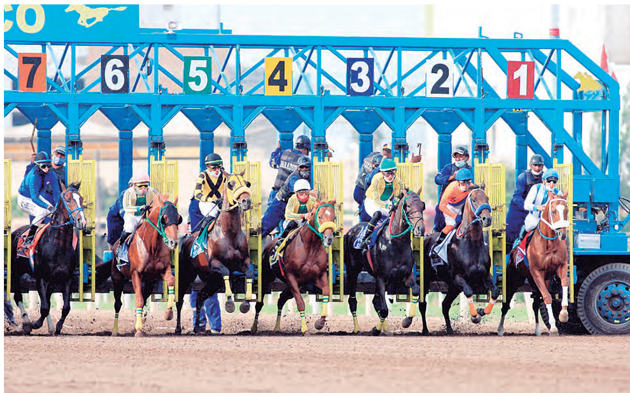
Las mejores en la pista

AREQUIPEÑISIMA es favorita en la Polla de Potrancas.