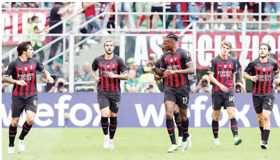
Los 'rossoneri' celebran uno de los goles anotados ayer.

ROSSONEROS VENCIERON A Inter 3-2 y capturaron el primer lugar al lado del Nápoli que superó a Lazio 2-1.