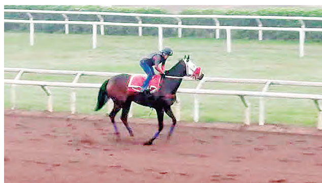
La del Patriots viene de ganar el Pamplona (G1)