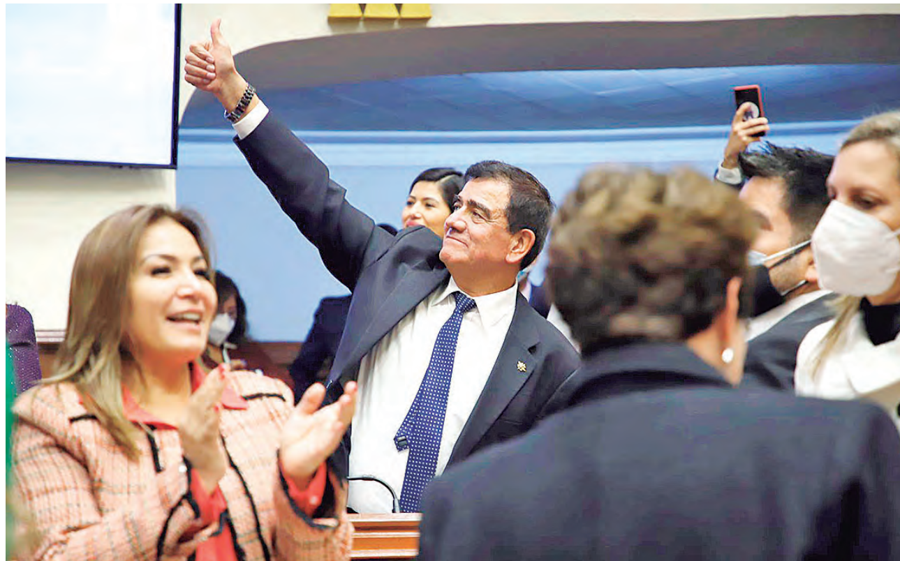
Con Williams en la Mesa Directiva, la derecha alista una nueva arremetida vacadora.

EL CONGRESISTA DE AVANZA PAÍS fue elegido como nuevo presidente de la Mesa Directiva, imponiéndose en segunda vuelta a Luis Aragón, de Acción Popular.