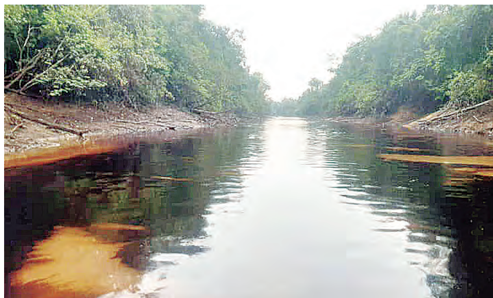
El derrame en Cuninico no parece importar mucho en la agenda política.

LAS COMUNIDADES AFECTADAS por el derrame de petróleo ocurrido la semana pasada aún esperan por una debida atención, frente a la contaminación de sus fuentes de agua y alimentos. De no escucharse sus pedidos, hoy iniciarían una movilización de protesta.