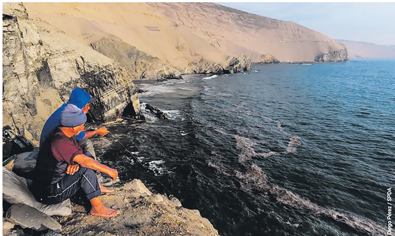
Diego Pérez / SPDA

Melchor también señaló que en los casi diez meses que han transcurrido desde el desastre ambiental solo han recibido seis bonos. Además, cuestionó que se pretenda negociar una indemnización sin tener claridad sobre el real impacto del derrame. "Quieren arreglar una indemnización, pero cómo se puede llegar a una indemnización cuando