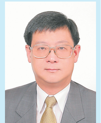
Chang Tzi-chin Ministro de la Administración de Protección Ambiental República de China (Taiwán)

Debido a factores políticos, Taiwán está actualmente excluido de las organizaciones internacionales y no puede participar sustancialmente en las discusiones sobre asuntos climáticos globales. Es difícil para Taiwán mantenerse al tanto de los desarrollos actuales e implementar adecuadamente las tareas relacionadas. Esto creará brechas en la gobernanza climática global. Taiwán tiene fuentes de energía independientes limitadas y un sistema económico orientado al comercio exterior. Por lo tanto, si no puede vincularse a la perfección con los mecanismos de cooperación internacional bajo el Acuerdo de París, esto no solo afectará al proceso de las industrias taiwanesas