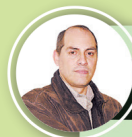
ANÁLISIS MUNDIAL IVLEV MOSCOSO DELGADO

CON SUS DOS GOLES, VENCIERON 2-0 A LOS RIMENSES. CERVECEROS SE "MAREARON" POR TANTOS CAMBIOS DE POSICIÓN EN LA ALTURA DE AREQUIPA