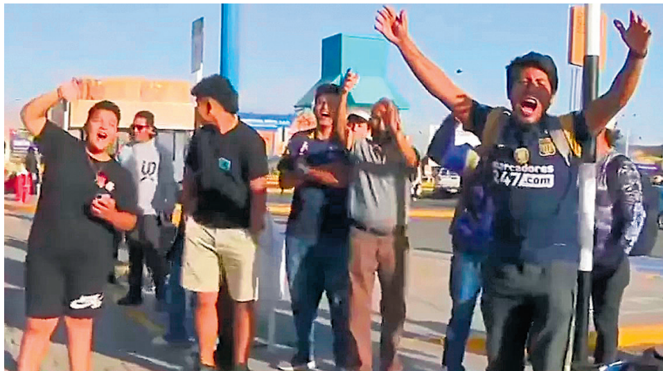
Hubo hinchas blanquiazules en los dos aeropuertos.