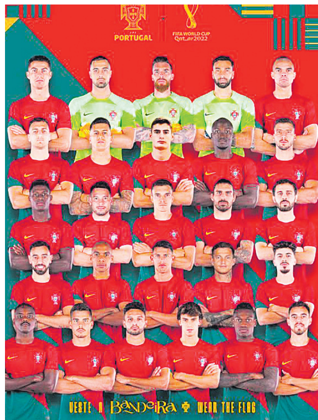
Plantel de Portugal que irá al Mundial y promete ser la sorpresa.

"LUSITANOS" OFICIALIZARON la lista de 26 jugadores para el Mundial de Qatar 2022, donde están en un grupo complicado.