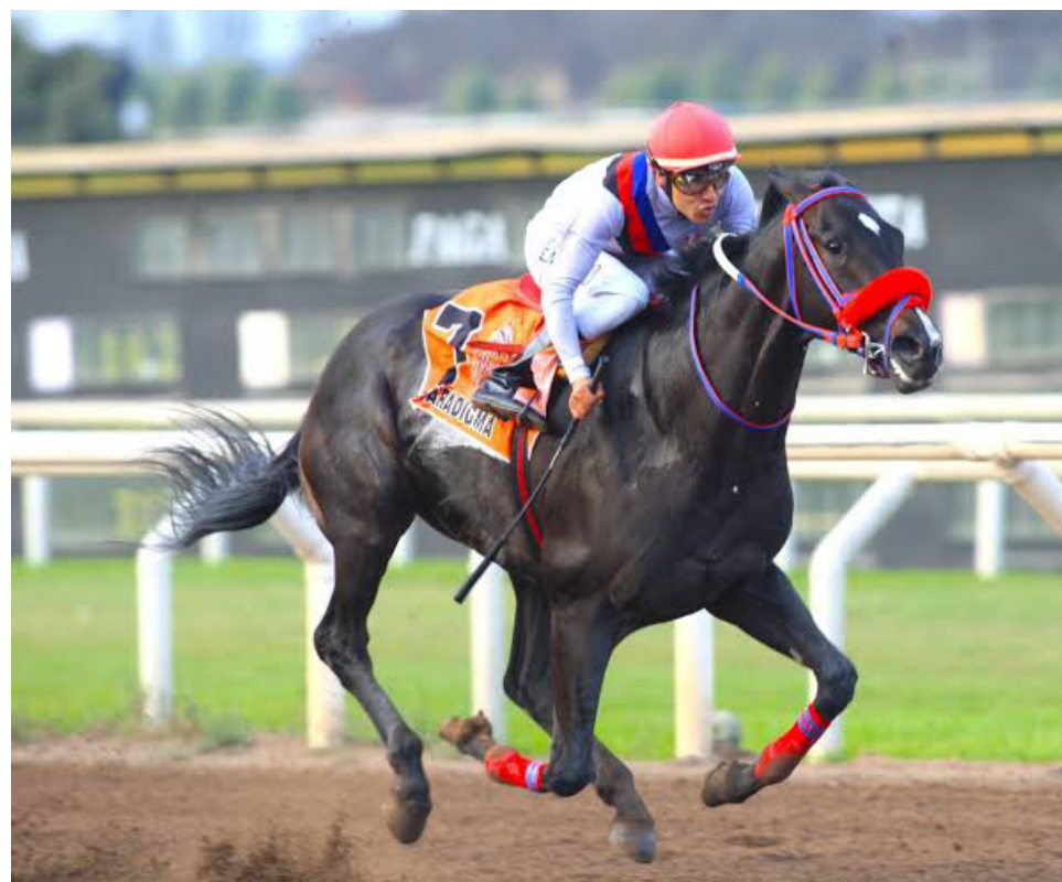
El del Black Label, de momento, el mejor de la generación

PARADIGMA Y OTROS JUVENILES FUERON TENDIDOS ENTRE SEMANA