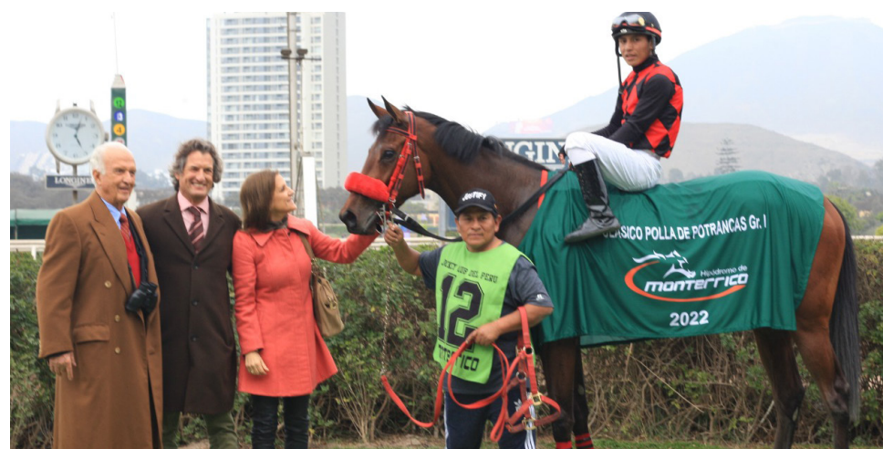
La ganadora del Cotejo correrá en el pasto

entrando tercero en el doble kilómetro. Opus es otro que estará en la carrera al igual que Es Incorregible, el cual obtuvo victoria en la condicional, esta semana.