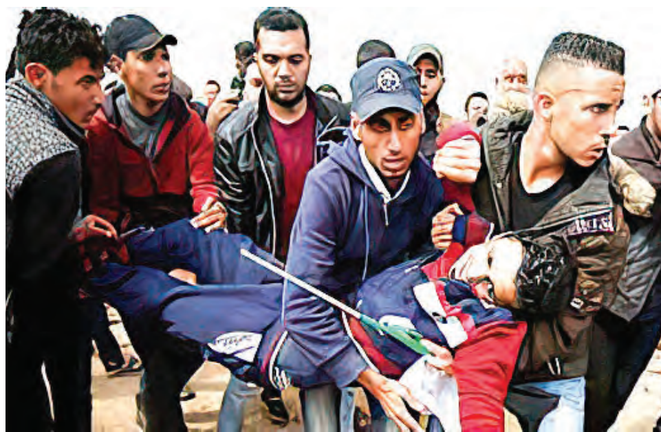
En breve podría iniciarse otro conflicto armado.

“Durante la operación, los terroristas abrieron fuego contra nuestras fuerzas. Las tropas israelíes