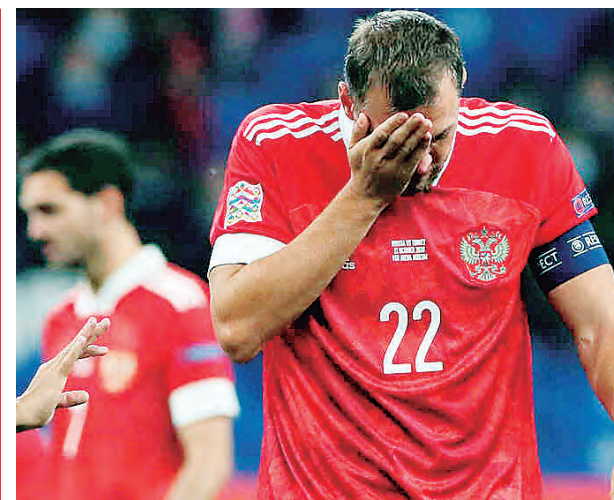
Jurídicamente es inadmisibles el veto a Rusia.