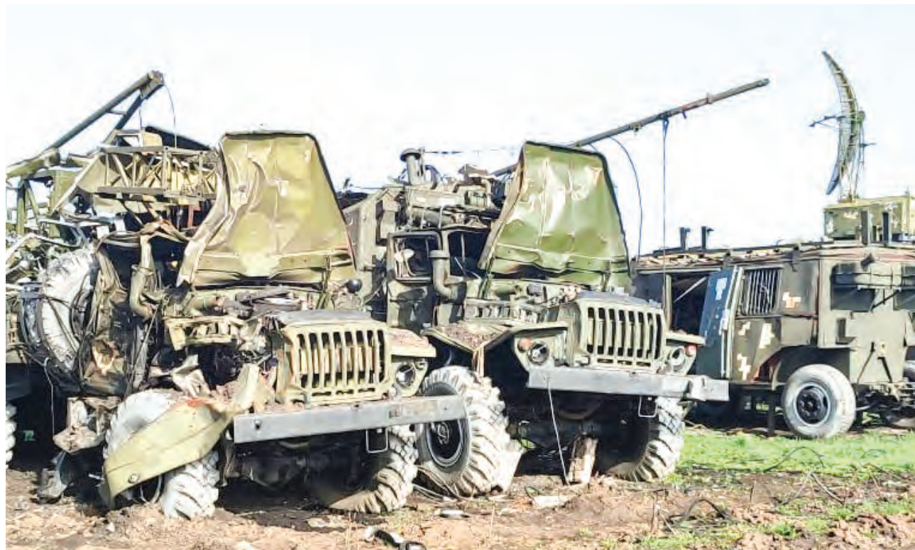
Equipos de guerra electrónica destruidos en Jarkov.

Fuerzas armadas anuncia toma de pueblos, prisiones, bombardeos de precisión y derribo de un caza Mig 29.