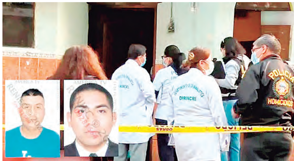
Víctimas fueron asesinadas en una vivienda por el sicario.