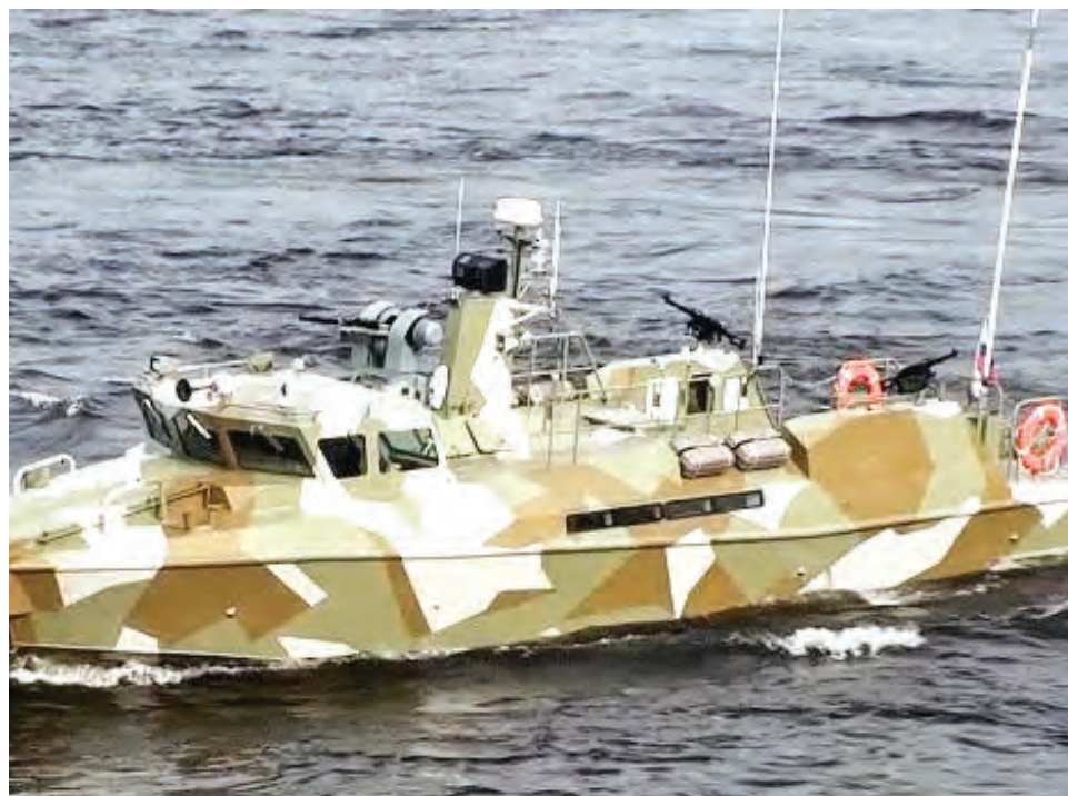
Eran lanchas antisabotaje modernas. Por sus potentes motores, aceleraba hasta 90 kilómetros por hora.

tar”, dijo el comandante en jefe de las fuerzas armadas de Ucrania, Valerii Zaluzhnyi, en su canal de Telegram.