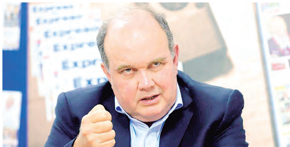
Rafael López Aliaga, con un discurso con contenido criollo-fascista.

en vista de la ausencia de partidos políticos, el vacío es ocupado por los evangélicos que han incursionado en política y tienen experiencia en el poder.