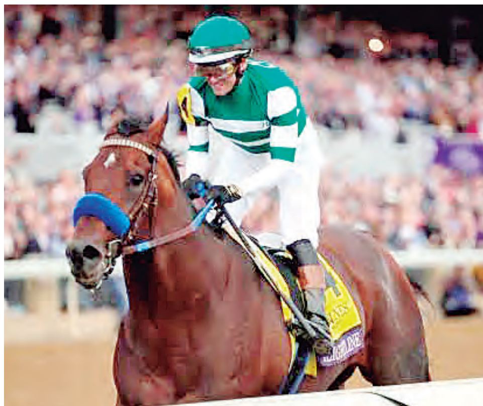
Fue la estrella en el hipódromo de Keeneland, Kentucky

Seis presentaciones, desde luego invicto. Un purasangre que, desde yearling, fue bien conceptualizado al costar un millón de dólares en subastas y que, estuvo a punto de no correr, cuando se lastimó sus bajos con un cerco de alambre, siendo juvenil. Hoy día, es el mejor caballo del planeta Trascendió que Flightline continuará campaña el próximo año para alegría de los que aman este espectáculo.