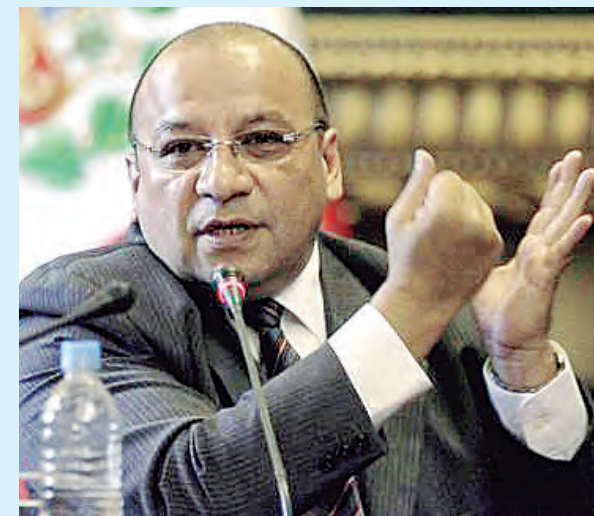
ANUNCIÓ EL TITULAR DEL MEF, KURT BURNEO

Castillo Terrones aseveró que cumplirá con permanecer en el Gobierno hasta el último día de su mandato, tal y como lo decidió la ciudadanía mediante elecciones generales.