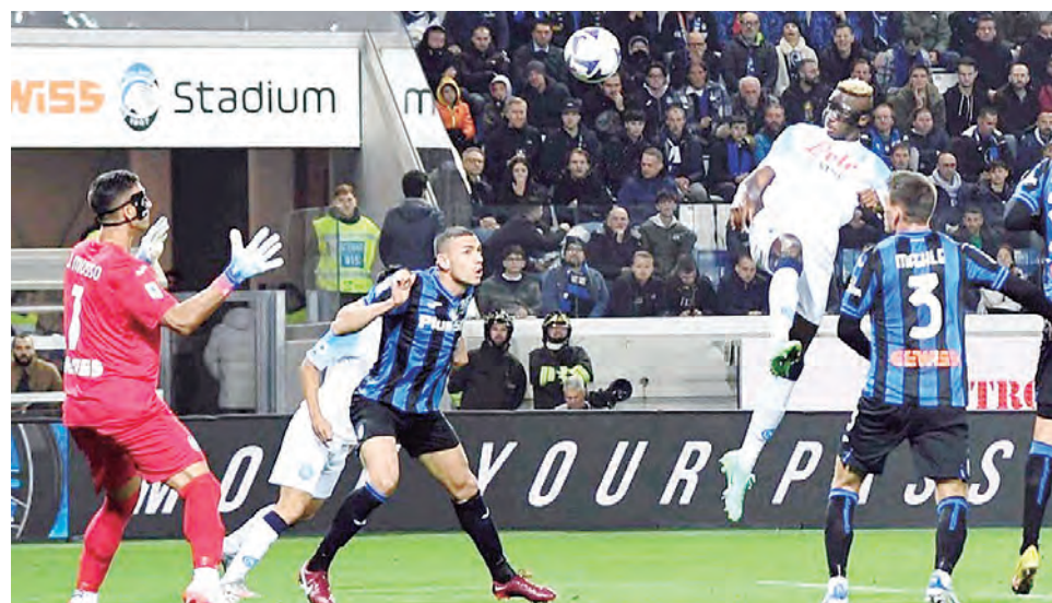
Osimhen anota el gol del empate parcial del Nápoli, que logró tres puntos de oro.

VENCIO A ATALANTA de visitante 2-1 y le sacó ocho puntos de ventaja. Milán a su vez derrotó a Spezia 2-0.