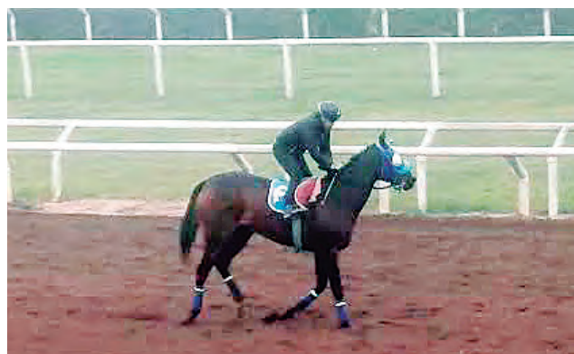
Ola Perfecta sale con destacados ejercicios