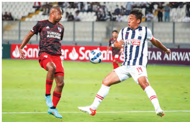
Fue muy poco lo que hizo Benavente en el partido.

River salió con 4-1-3-2. Utilizando a Barco como delantero junto a Álvarez. Mientras que detrás estaban Simón, Fernández y De La Cruz. En tanto que Pérez era el único volante para la marca. River comenzó mejor, pero no tenía mucha profundidad. Un remate de