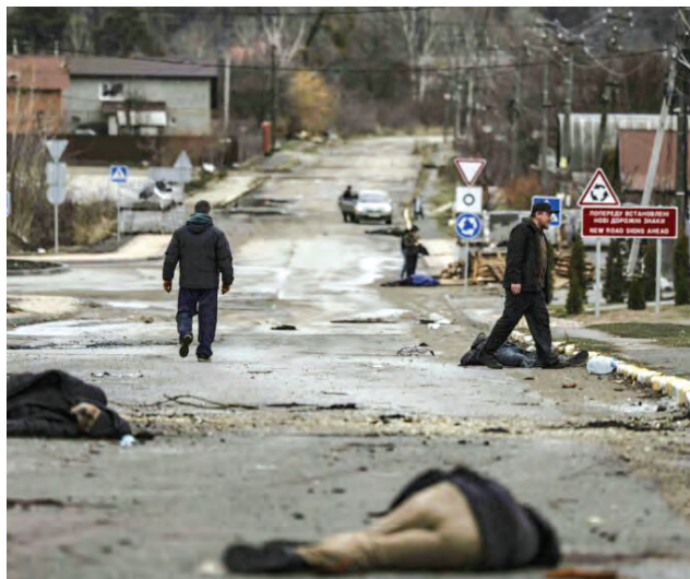
Rusia presentó como “prueba” un muerto que “camina”.

Zelensky no es el único líder mundial que presenta la acusación de genocidio contra Rusia. El primer ministro británico, Boris