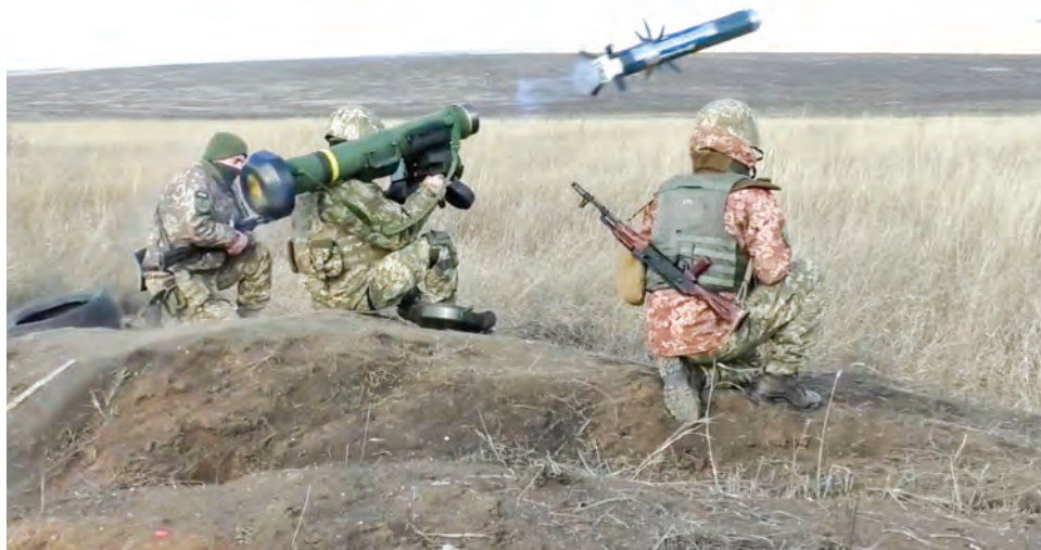
La OTAN sigue "alimentado" la guerra en Ucrania.

Stoltenberg no dio detalles, sin embargo, un poco antes, las fuentes informaron que la alianza militar planea transferir a Ucrania durante las próximas dos semanas hasta 20 mil sistemas de misiles an-