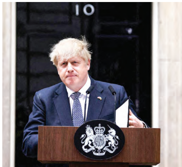
El mandatario británico nació en Nueva York, Estados Unidos.

Johnson señaló que ya habló con Graham Brady, jefe del Comité Conservador de Miembros Privados,