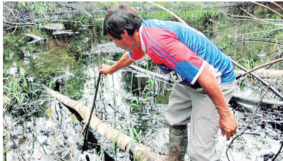
Los derrames de petróleo han generado enfermedades en la población.

PCM, MEF Y MINSA no aprueban presupuesto para la atención de comunidades kukama, urarina, achuar, quechua y kichwa afectadas por la actividad petrolera en Loreto.