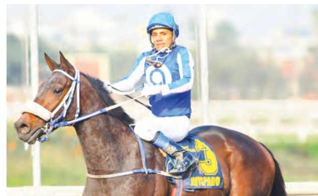
El hijo de Azarenka correrá el Clásico Hipódromo de San Felipe.