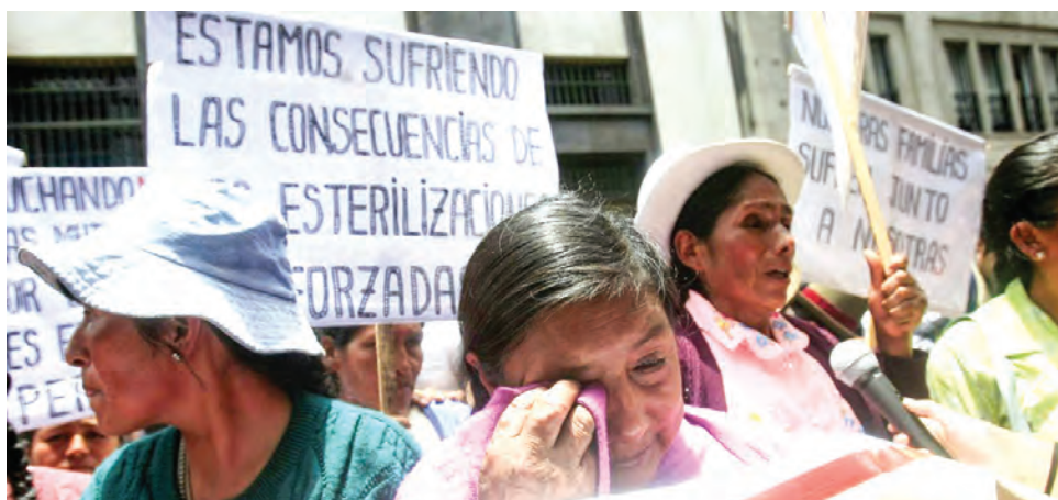
Cambios en la Fiscalía terminan por afectar casos emblemáticos.

ADVIERTEN QUE LOS CAMBIOS EN LA FISCALÍA, sin explicación alguna de por medio, retrasan la obtención de justicia en el caso que se arrastra desde la dictadura fujimorista.