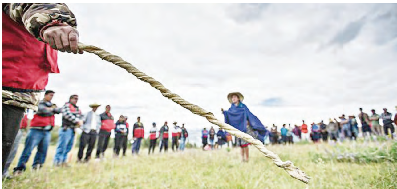
La Fiscalía ya investiga el caso por presunto secuestro y hurto.

LA CUNARC EMITIÓ UN COMUNICADO acusando un tratamiento mediático prejuicioso y recordó que quienes ingresen a sus territorios deben pedir autorización. Mientras tanto, la Fiscalía de Bambamarca ya inició una investigación de oficio.