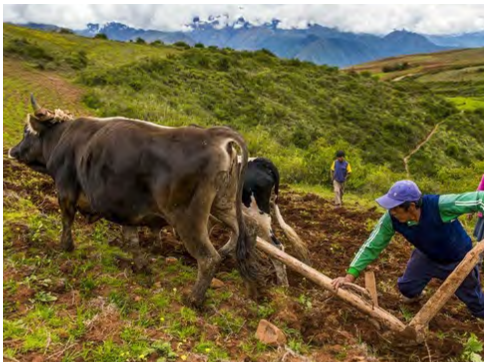
Sector agrario en crisis.