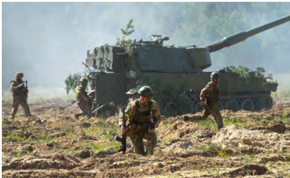
Las tropas ucranianas se reagrupan.

prometió luchar allí el mayor tiempo posible y dijo que la batalla podría ayudar a dar forma al curso futuro de la guerra.