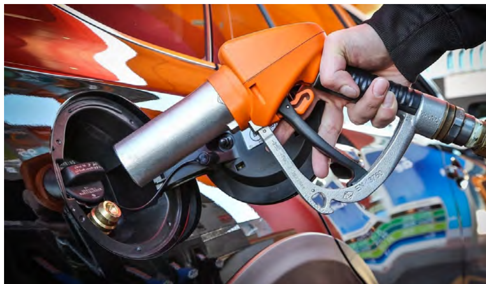
Grifos no podrán satisfacer la demanda vehicular.

La SPGL indicó que el inventario nacional de este combustible es afectado por razones climáticas y de desabastecimiento en