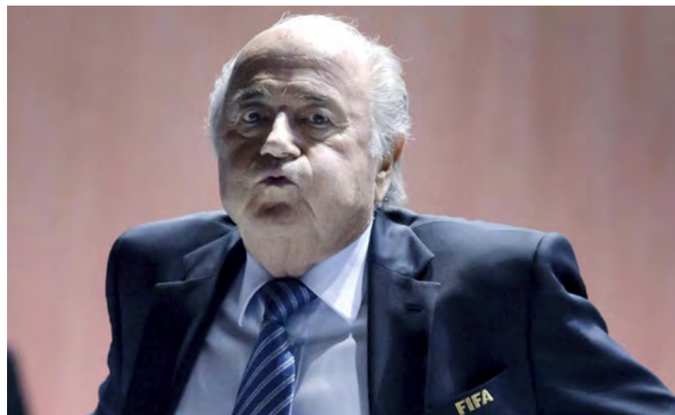
Blatter llevaba 17 años como presidente de la FIFA cuando renunció en junio de 2015.

Se anticipaba que Blatter, de 86 años, iba a declarar, pero al ser llamado al estrado cuando faltaba una hora para completar la jornada — luego de varias mociones de la defensa que fueron re-