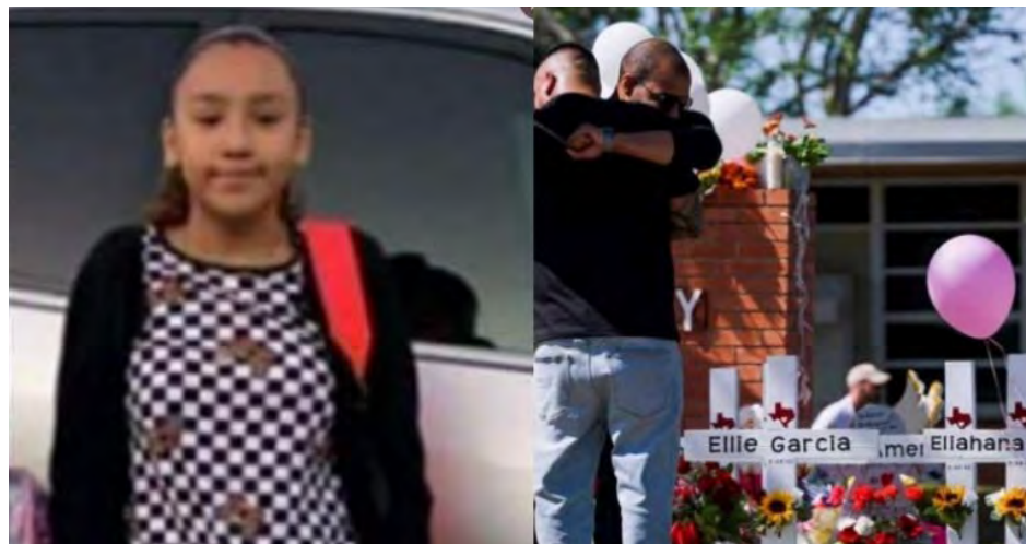
Fue la única sobreviviente de su aula.