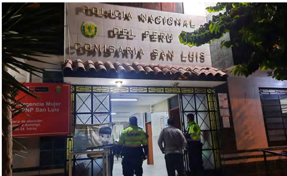
Delincuencia ha ganado terreno en San Luis.

DETENIDO LIBRE. Además, aseguró que uno de los dos serenos involucrados ya no se encuentra detenido. “Chaparon a dos y ahora acá en la Comisaría de San Luis solo hay uno. No entiendo cómo se ha escapado el otro detenido o lo han dejado ir”, manifestó la mujer.