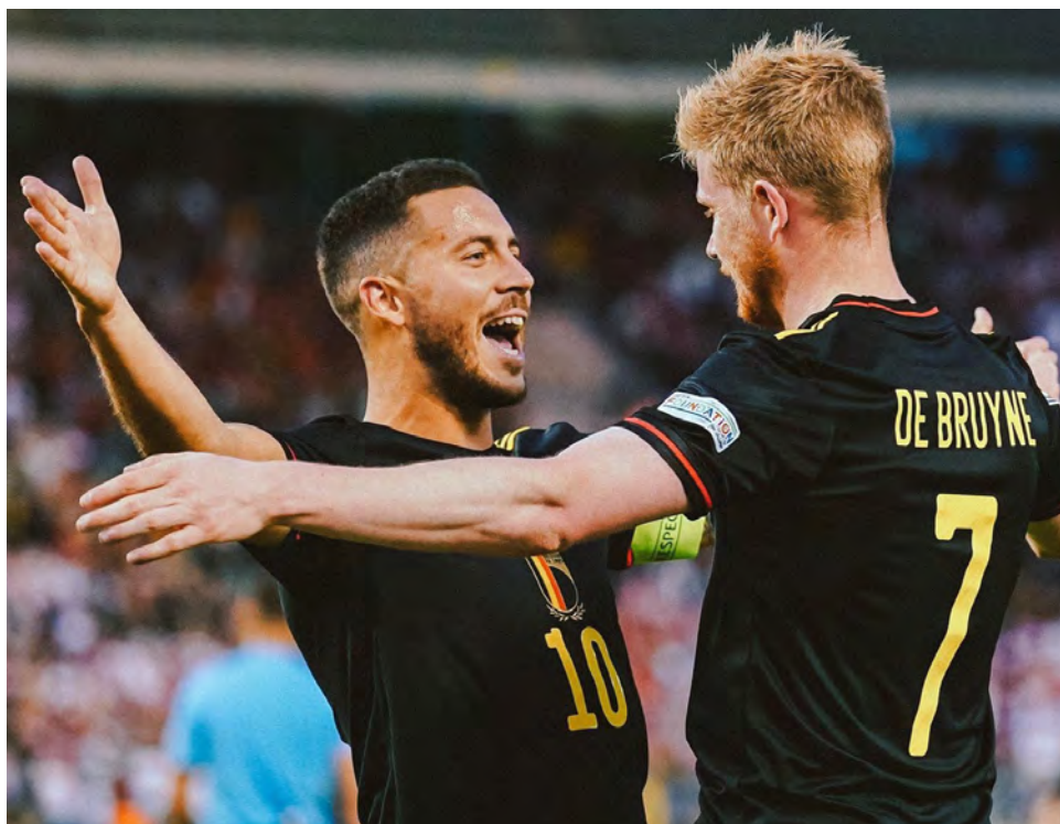
Dos Estrella belgas, Hazard y De Bruyne.

En la segunda jornada de la UEFA Nations League, Polonia venía de vencer a Gales y buscaba el primer lugar del Grupo 4. Todo empezó de la mejor manera para los 'blanquirrojos', ya que el goleador Robert Lewandowski abrió el marcador a los 27', pero el local igualó por medio a Axel Witsel a los 41'.