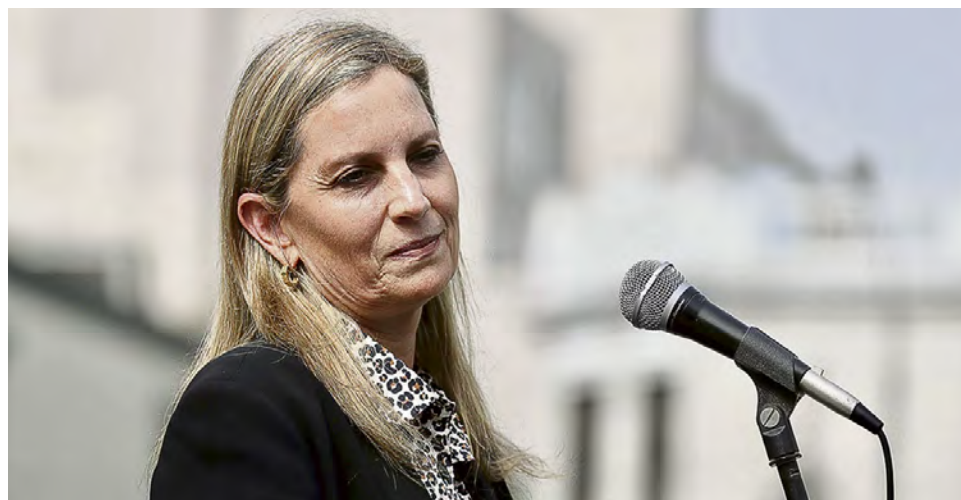
La pretensión de llegar a Palacio le pasa la factura a la presidenta del Congreso.

La acusación se sustenta en audios filtrados de la acciopopulis-