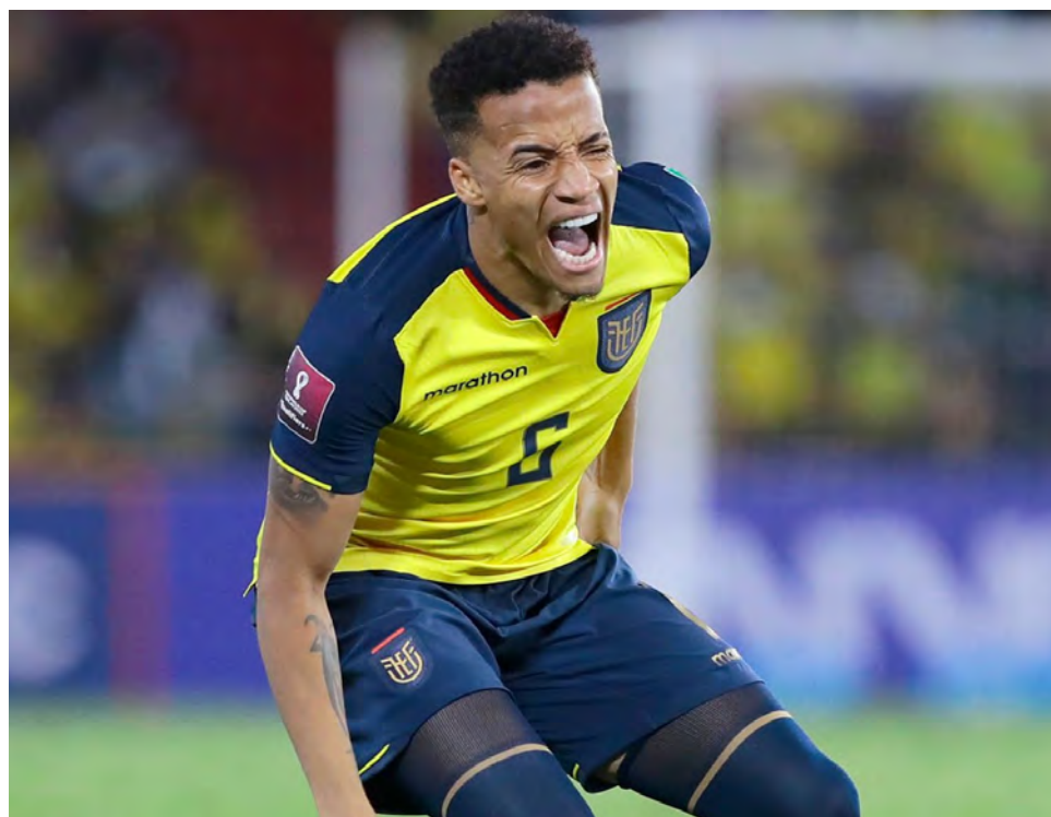
Muchos medios peruanos se colgaron de la información mexicana.