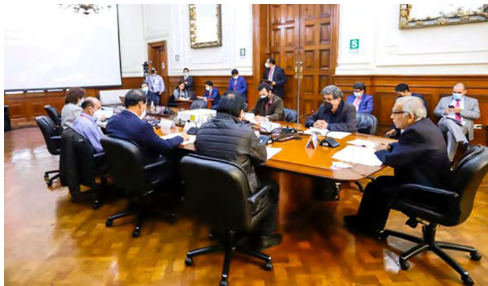
Torres lideró la reunión con representantes de seis ministerios.

guerra entre Rusia y Ucrania han repercutido en el alza del precio de los combustibles y el deterioro de la cadena de suministro de alimentos, acelerando