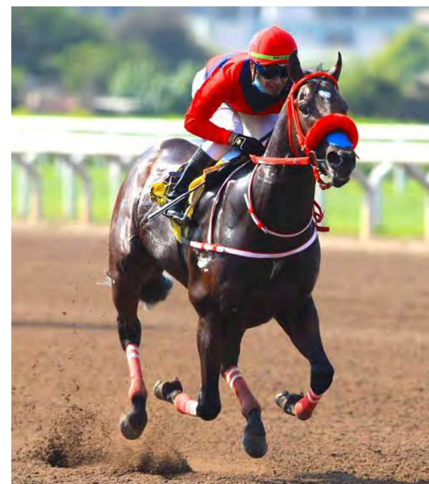
Final Call aprontó bárbaro ayer

En cuanto a las potrancas, la expectativa está con las hijas de Southdale, Pankenka y Peruvian Cosmic, ambas ganadoras clásicas.