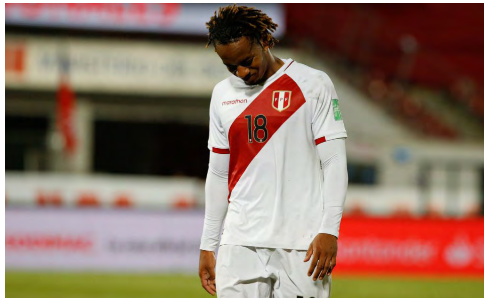
Para los australianos es casi un misterio como Perú jugará el repechaje.