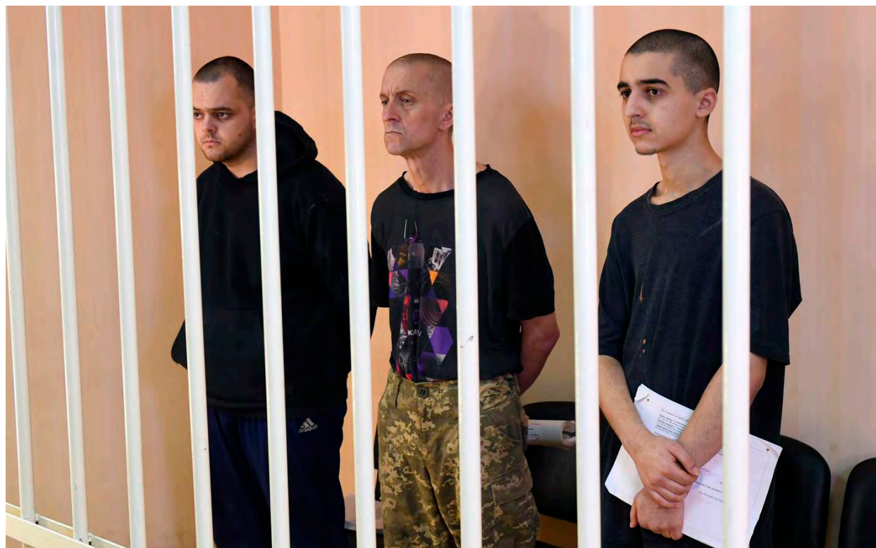
Los tres prisioneros que fueron sentenciados a la pena capital.

Dos británicos y un marroquí que pelearon por Ucrania en Mariupol. Pueden apelar la sentencia sino serán fusilados.