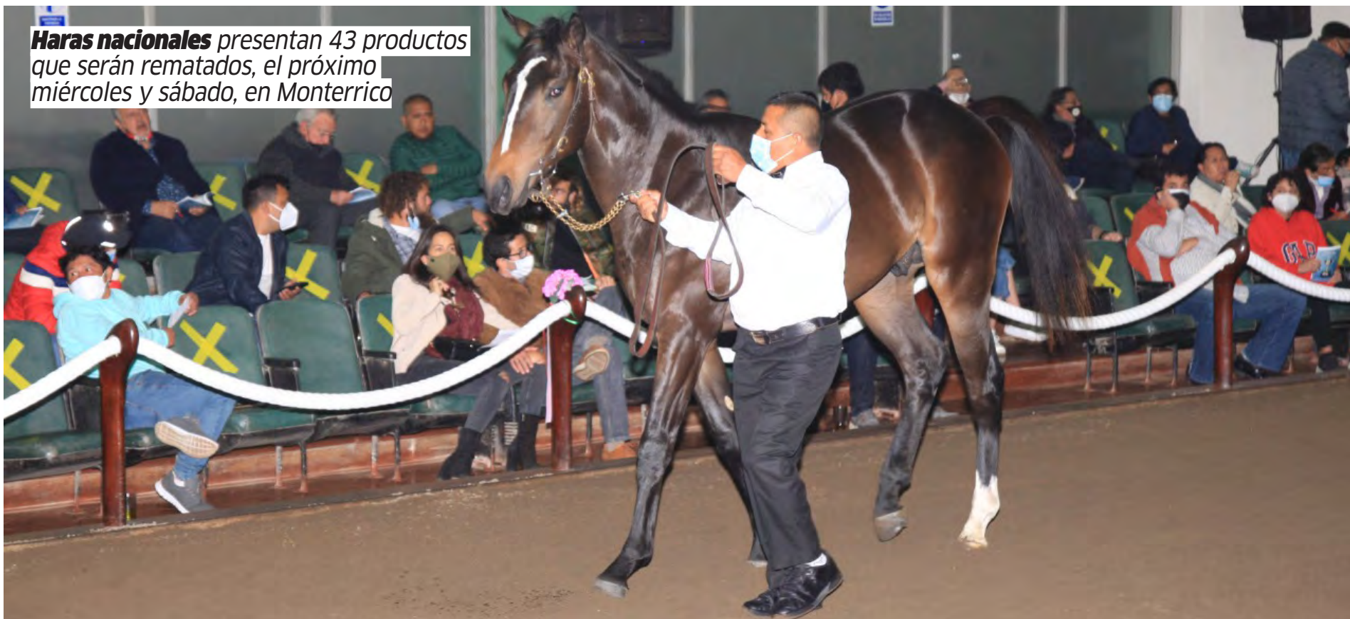
La próxima semana desfilarán en el Ring de Ventas

Haras nacionales presentan 43 productos que serán rematados, el próximo miércoles y sábado, en Monterrico