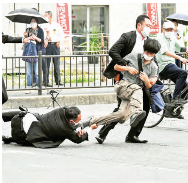
El asesino le disparó en el cuello y en el brazo.

Si bien el motivo del agresor de 41 años no se conoce completamente, muchos han criticado duramente el tiroteo durante un discurso en una calle en la ciudad occidental de Nara por sacudir los cimientos de