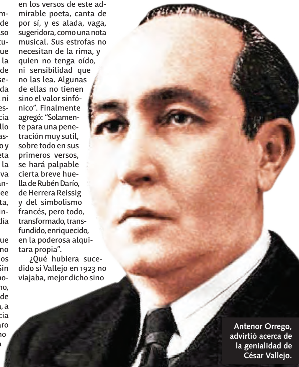
Antenor Orrego, advirtió acerca de la genialidad de César Vallejo.

2.- Mi encuentro con César Vallejo. Antenor Orrego. Tercer mundo editores. Pág. 101. Bogotá, 1989.