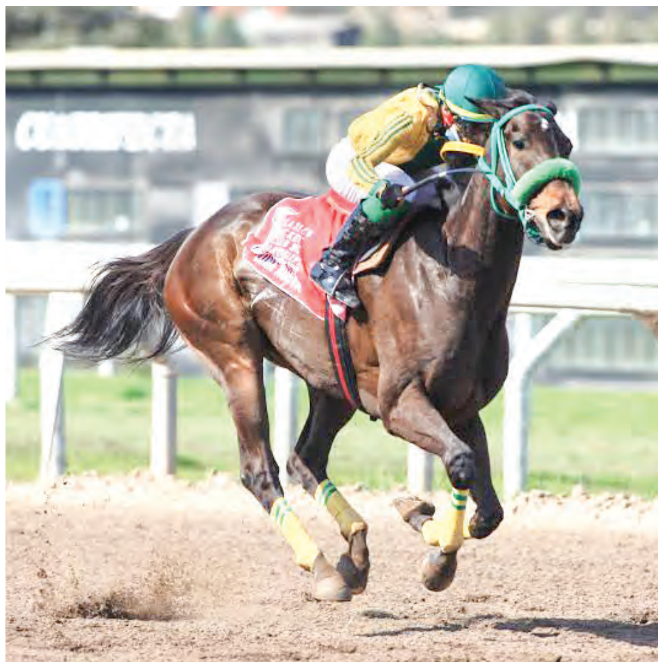
El Doña Licha busca el arrase en las selectivas del fin de semana

FONDISTAS EN ACCIÓN POR EL CLÁSICO ESTADOS UNIDOS DE NORTEAMÉRICA; Super Corinto reiniciará entrenamientos este lunes en Florida