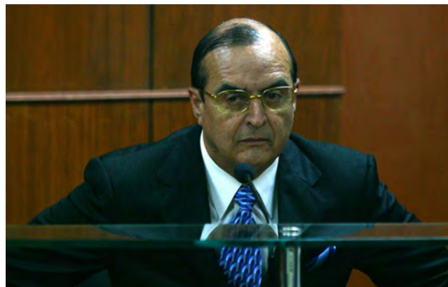
Montesinos es favorecido con una resolución judicial entre gallos y medianoche.

“Ordenan que la presidencia del Instituto Nacional Penitenciario disponga el traslado del interno Vladimiro Montesinos Torres del