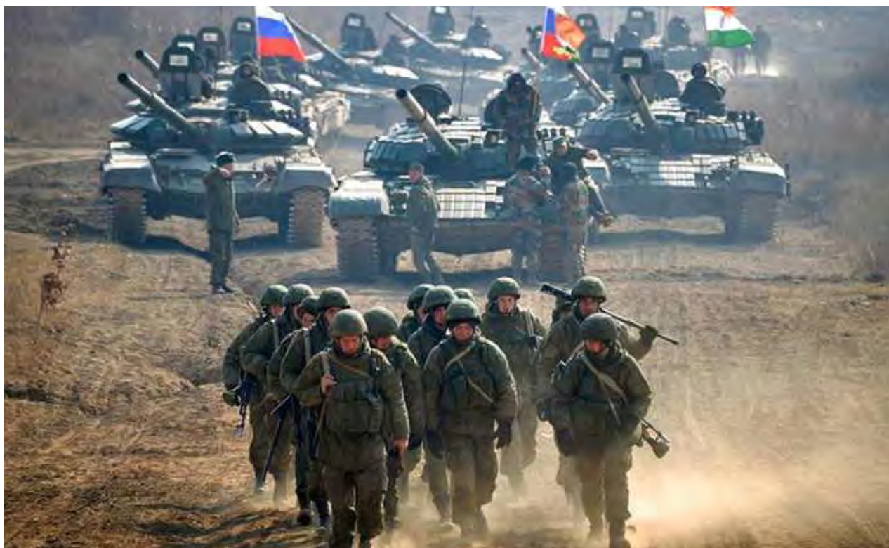
Las tropas rusas ahora se dirigen a Lysychansk.

La batalla por Severonetsk parece llegar a su fin. Kiev reconoce que restan pocos defensores en el área.