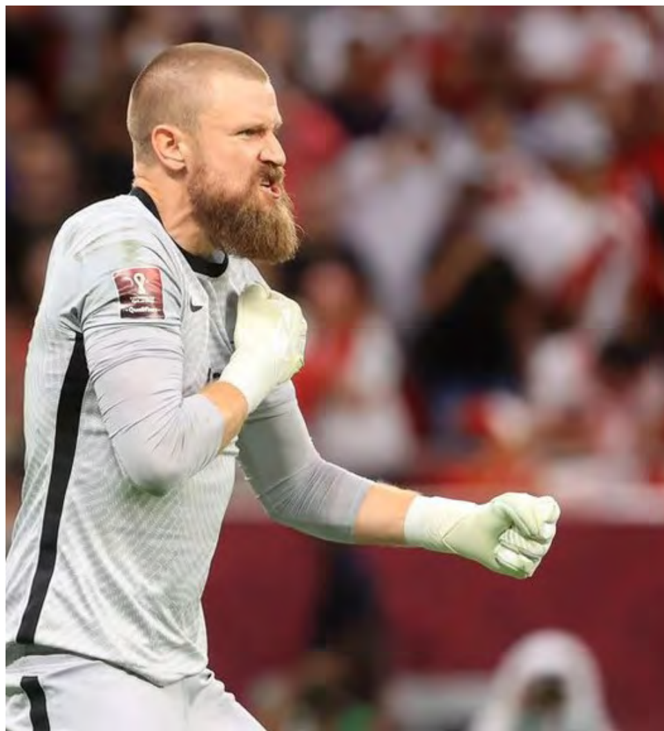
En un momento, estuvo a punto de fichar por Arsenal.

usando esa misma técnica fue la figura en la definición del título que su equipo, el Sydney FC, le ganó por 4-1 en los penales a Perth Glory por la final de la liga del fútbol australiano. En esa oportunidad contuvo dos penales y en uno de ellos, acertó la intención de picarla de su rival.