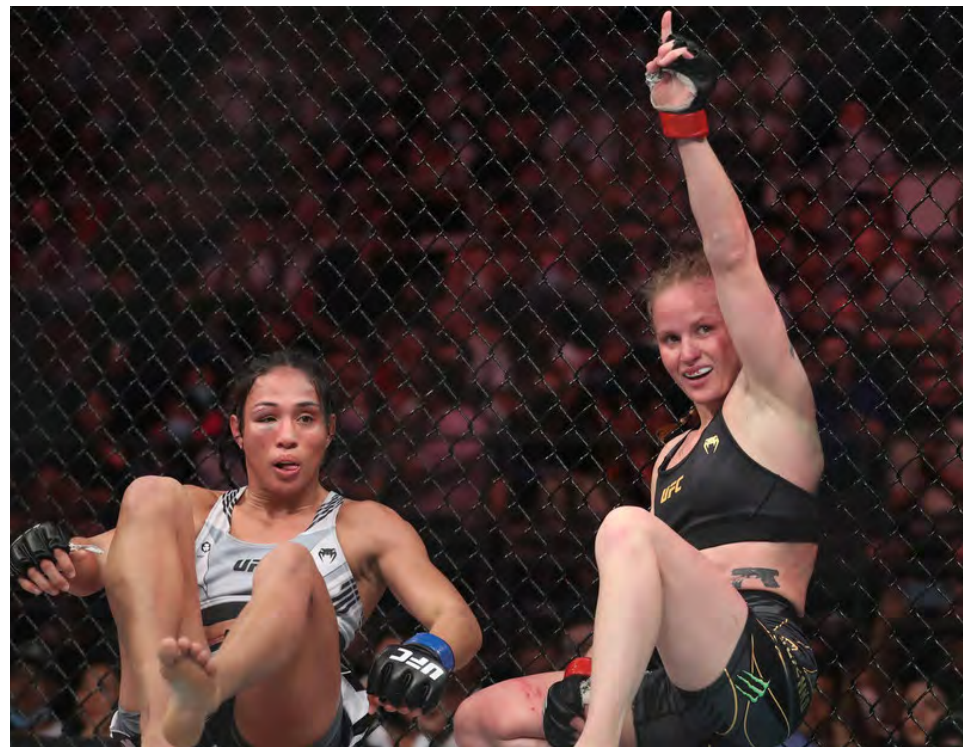
La luchadora representa a Perú en sus combates.