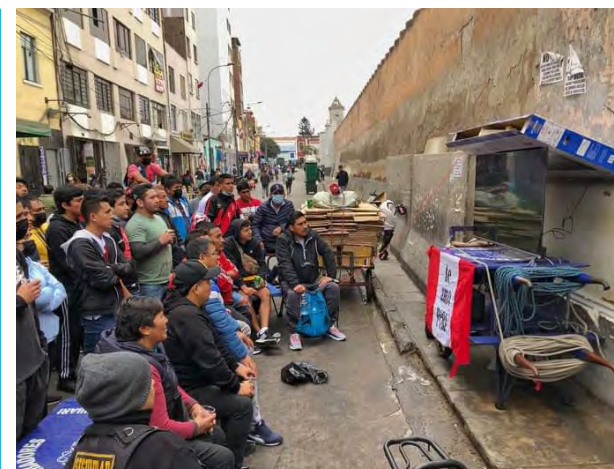
FOTO LEYENDA: Los peruanos ayer hicieron de todo para ver el partido de Perú contra Australia. En la foto que un lector de Diario UNO nos envió, todos los vecinos de la cuadra 4 del Jr. Inambari en Barrios Altos vieron el partido en un televisor de 50 pulgadas de un vecino. Lástima que no se consiguió el objetivo.

veterinaria y especialista en fauna Silvestre de la ATFFS Lima, recomendó que los domicilios deben estar totalmente limpios y en orden; sobre todo, en los espacios en los que no hay mucha ocurrencia.