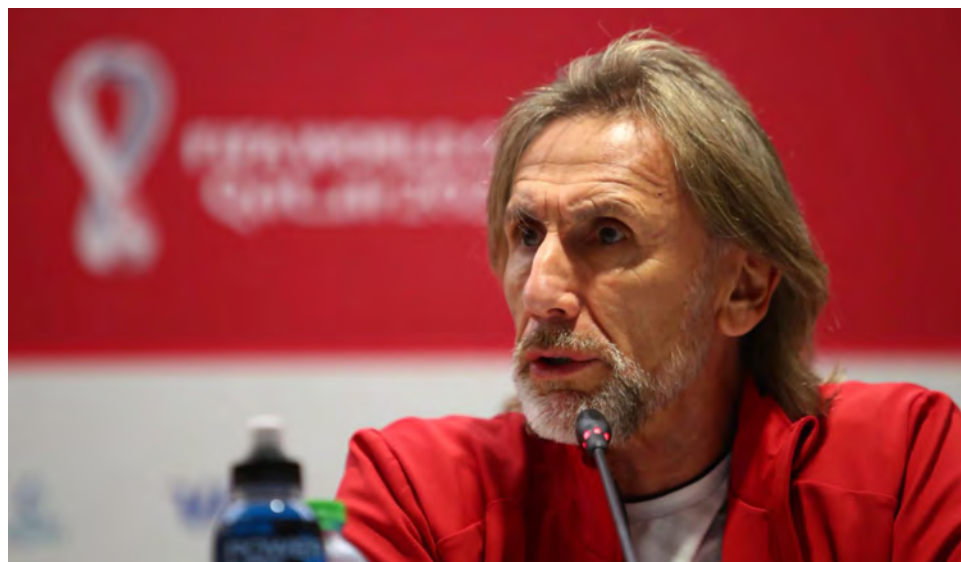
Al quedar Perú eliminado, Gareca terminó su contrato y está libre.

“Sabemos el apoyo y sacrificio de la gente. Muchos vinieron de lejos, de todas partes del mundo y en Perú también. Sé lo que moviliza la selección. Queríamos darle (a la afición) esa posi-