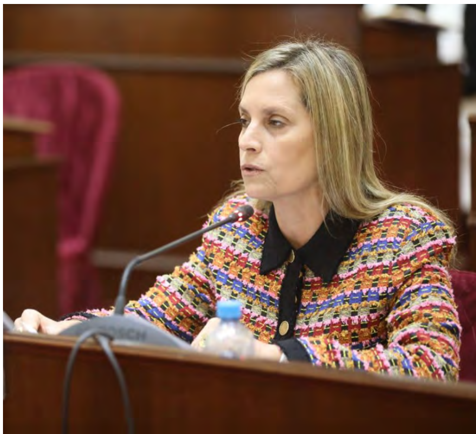
Acusan a Alva de desacato y desobediencia a la autoridad judicial.

sindicato de la Defensoría advirtió que procederá a “poner de conocimiento al juzgado respectivo para que actúe conforme a ley”.