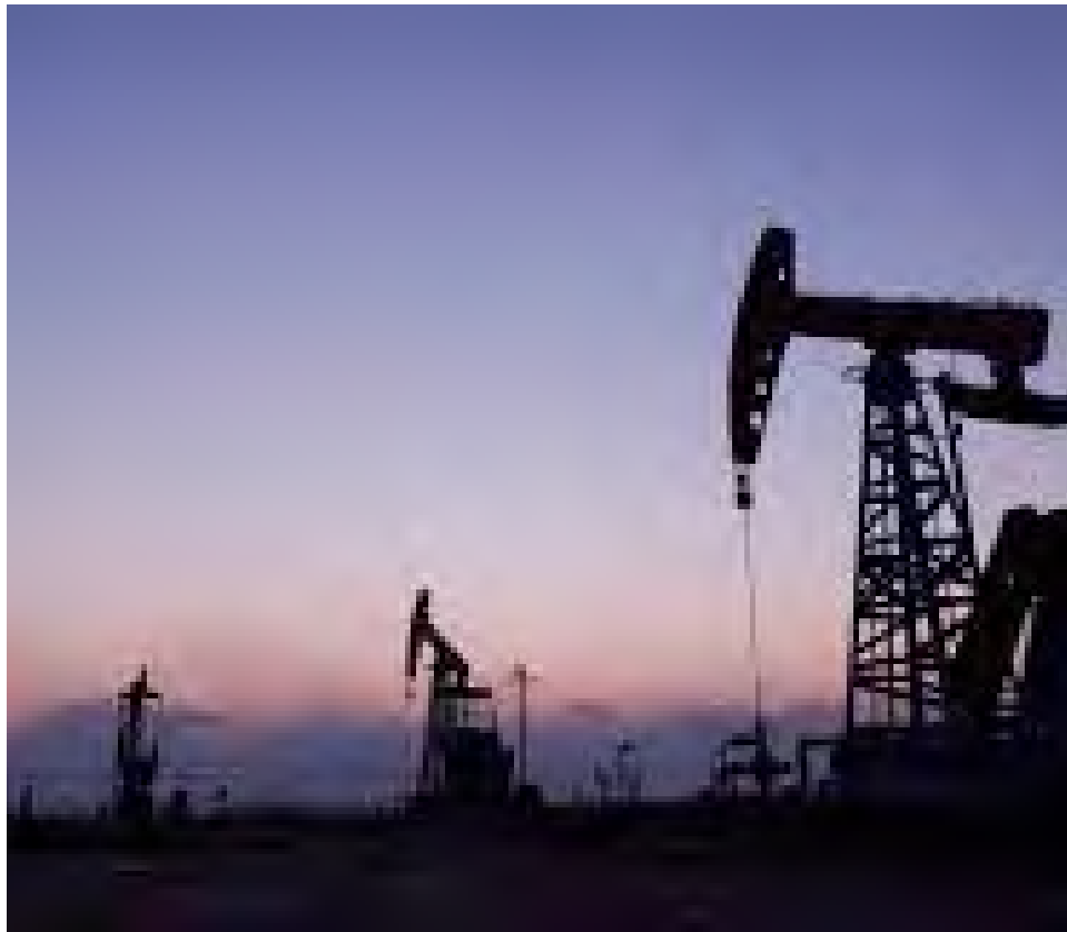
Parece que las sanciones de Occidente a Rusia no les causa mayor daño.

“Los últimos datos e informes que tenemos sugieren que Rusia gana alrededor de 1000 millones de euros al día con las exportaciones de combustibles fósiles a nivel mundial”, resalta el analista de investigación del Bruegel