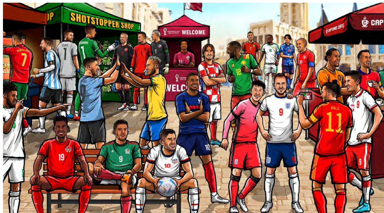
Un colorido dibujos con las estrellas del fútbol compone el poster de Qatar 2022.

Además del póster oficial, el Mundial de este año contará por primera vez con una colección de carteles