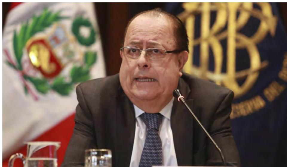
Velarde resaltó el control de la inflación.

En ese sentido, se buscará generar evidencia que propicie soluciones efectivas y orien-