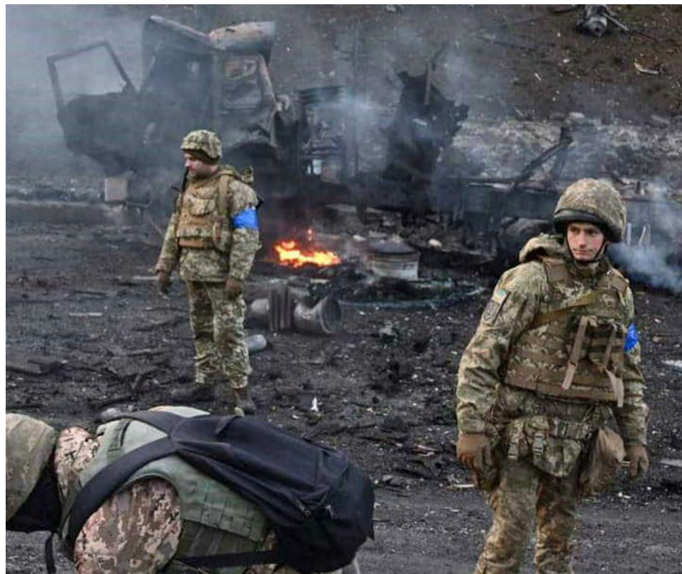
Más de 100 ucranianos mueren al día y las pérdidas parecen ahora más que las rusas.

Moscú les dio un ultimátum a los combatientes de la planta de Azot, parece una réplica de lo que pasó en Azovstal.