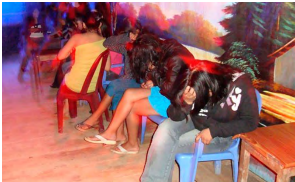
Operativo en prostíbulo con fachada de bar en Madre de Dios.

El 68% de las denuncias ingresadas entre 2018 y 2019, fueron archivadas. El 3.2% concluyó en sentencia. Además, entre los años