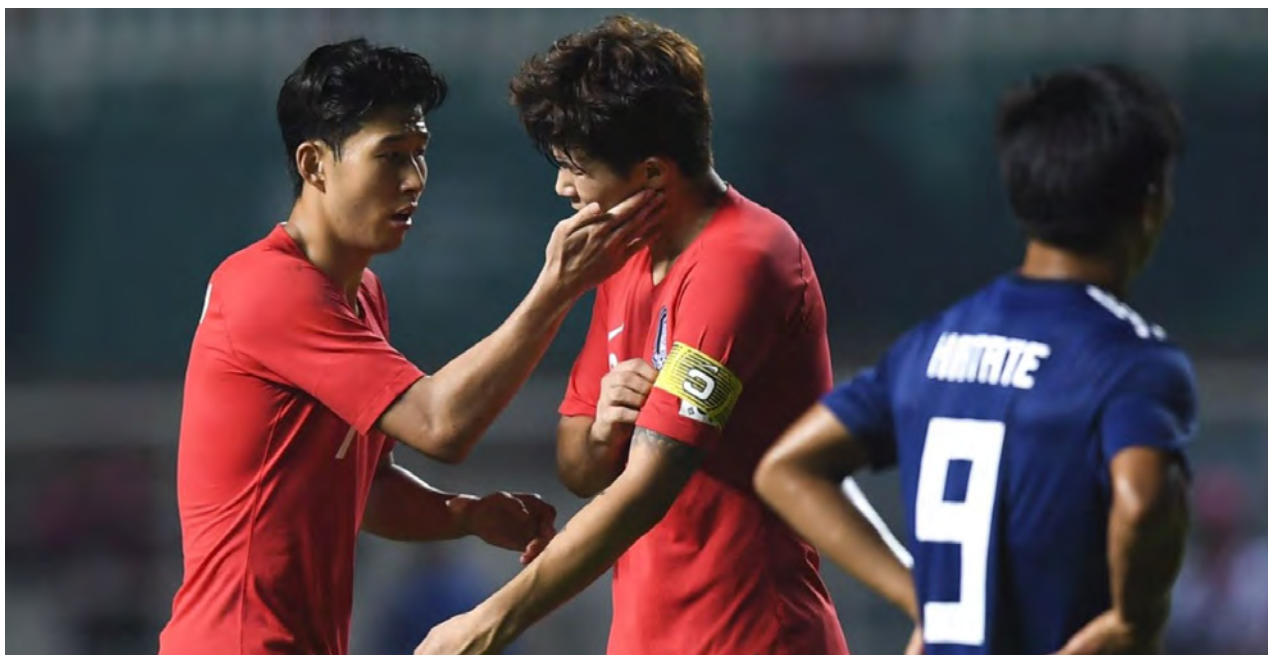
El ente máximo sudamericano lamentó que la International Board no les consultara.

El fiscal Thomas Hildbrand no reclamó una pena de prisión en firme contra el exjugador francés de 66 años y el suizo de 86 años.