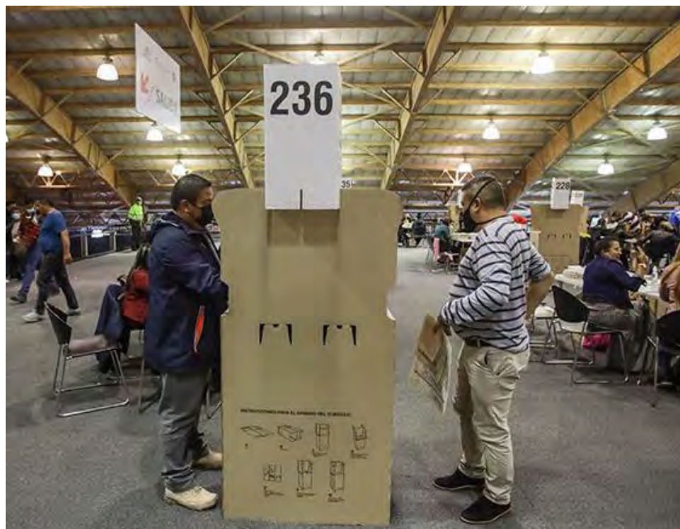
La izquierda por primera vez podría ganar en Colombia.

a los grupos de poder que han gobernado desde siempre la nación suramericana.