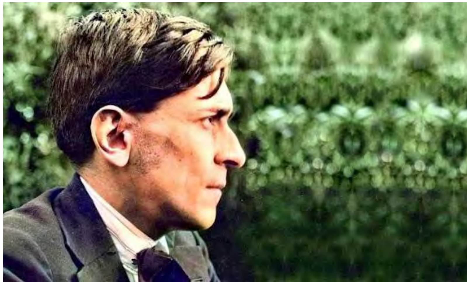
Mariátegui falleció cuando se proponía instalarse en Buenos Aires.

Esta es la primera carta de Churata a Mariátegui: “Puno, 24 de Abril de 1929. Querido compañero Mariátegui: Debe usted estar extrañando mi silencio de tantos días. Pero es que la Vida, así, con mayúscula, sigue atacando mis izquierdas revolucionarias