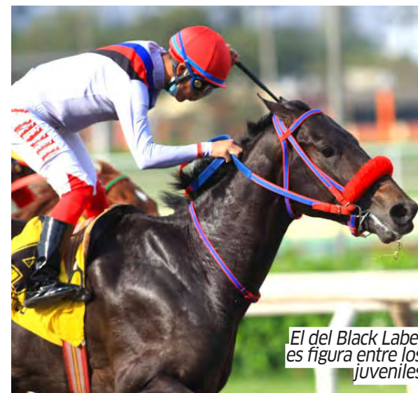
El del Black Label es figura entre los juveniles