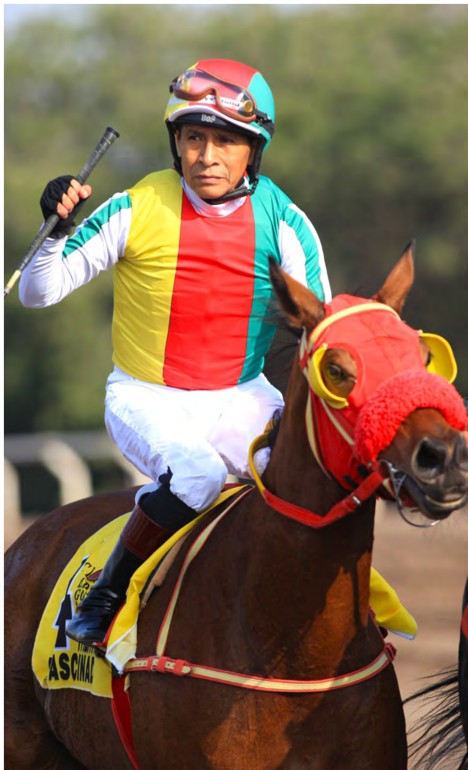
Celebra el triunfo con la yegua del Agustín Gabriel