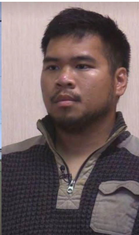
Druke de barba y Huynh podría ser condenados a muerte como los otros mercenarios.

pidieron que cubriéramos su retirada. Cuando estábamos cubriéndolos, las fuerzas rusas rebasaron nuestra posición y tuvimos que retirarnos completamente”, detalló Huynh, para quien era su