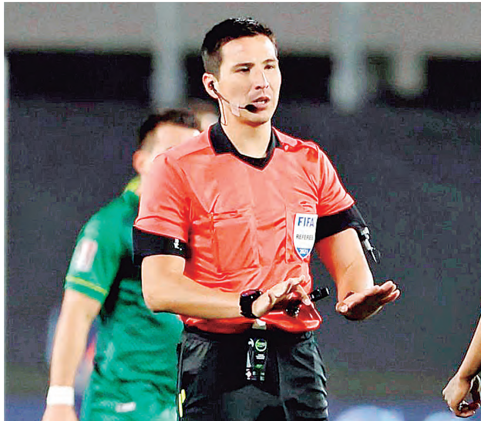
Ortega será nuestro representante en Qatar 22 en el tema arbitral.

FIFA indicó: "Tras valorar la calidad de su trabajo y el rendimiento mostrado en torneos de la FIFA, así como en otras competiciones nacionales e internacionales de los últimos años, en estrecha colaboración con las seis confederaciones se han escogido 36 árbitros, 69 árbitros asistentes y 24 miembros del equipo arbitral de video".