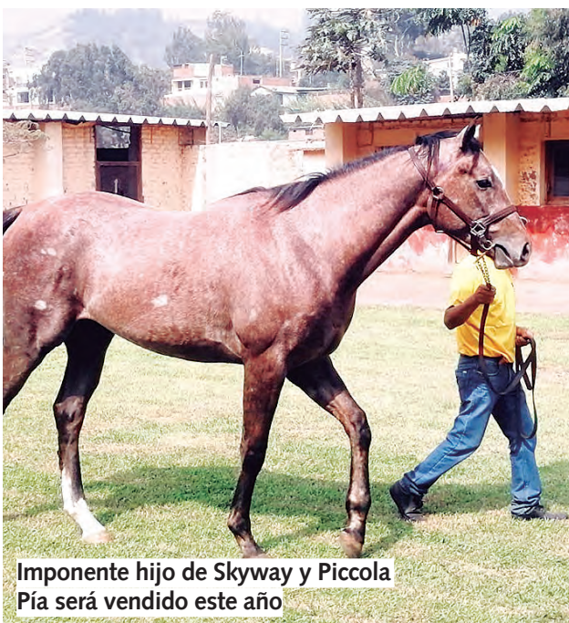
Imponente hijo de Skyway y Piccola Pía será vendido este año

Entre Chaclacayo y Chosica, se establecen casi 13 hectáreas dedicadas a la crianza del purasangre. Es el Haras El Embrujo, de la familia Orbezo, que recibió a la prensa para presentar a sus productos que saldrán a remate esta temporada. La apuesta grande con la primera generación de Editorial (War Front), el padrillo que llegó al país,