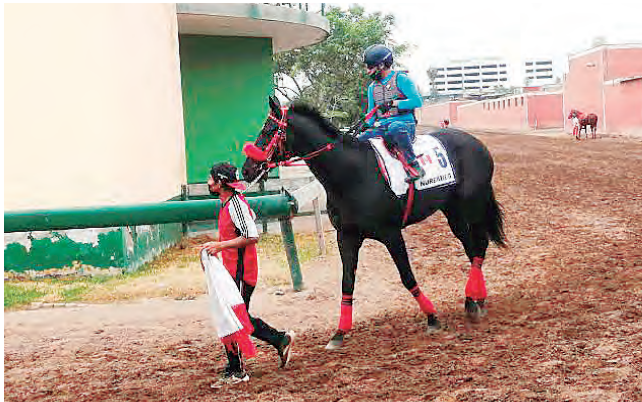
El egresado de Los Eucaliptos ha sido confirmado para la carrera.

Por su parte, desde el Stud Jet Set han manifestado la intención de correr en esta cita y luego avanzar al Jockey Club del Perú (G1). La también hija de Southdale viene de ganar La Copa (G2) y,