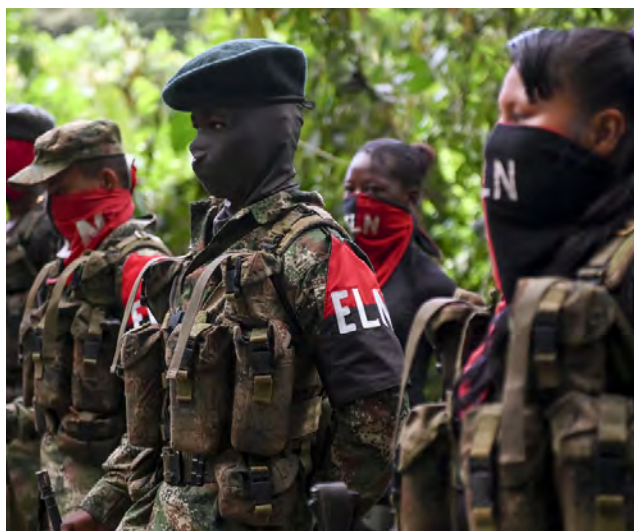
Miembros del frente Ernesto Che Guevara del ELN.

La agrupación emitió ese comunicado luego de conocerse el triunfo de Petro en el balotaje de los comicios presidenciales, celebrado el domingo en Colombia. Según los resultados de la Registraduría Nacional del Estado Civil, el candidato izquierdista obtuvo