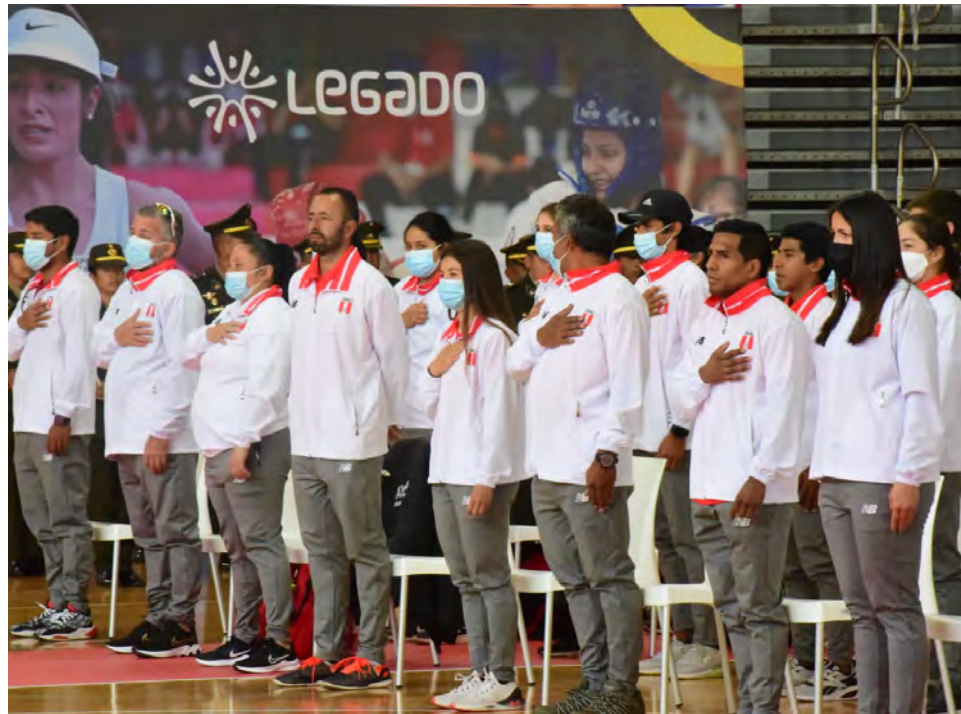
Un total de 400 deportistas peruanos en los Juegos Bolivarianos.