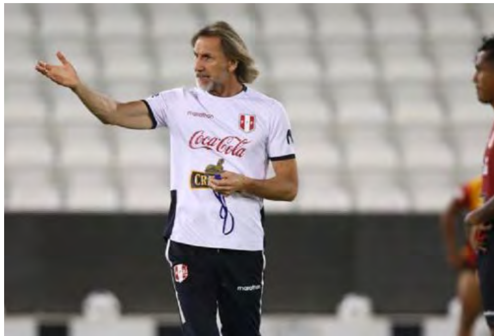
Por el momento se queda con la selección de Perú.

Gareca tuvo propuesta de la selección de Chile, Colombia y hasta del América de México. Todas ellas quedaron en el pasado. Lo de Egipto es la primera que tiene desde que terminó su vínculo con Perú. Se sabe que la federación de