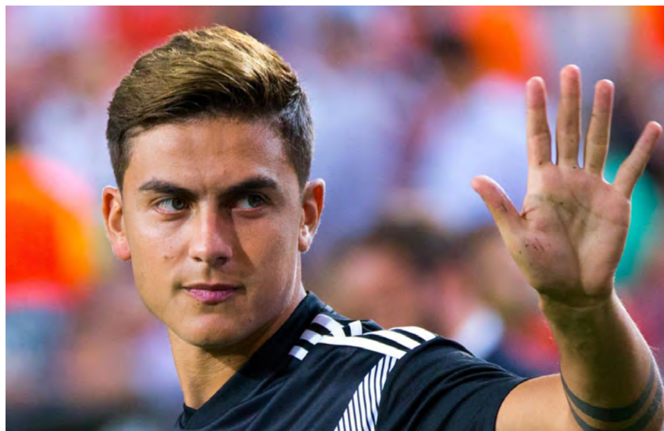
El futuro del volante argentino no sería en Italia.

El problema es que el entorno de Dybala no quiere esperar tanto a cerrar las negociaciones y es por eso que si el Inter estira demasiado la situación