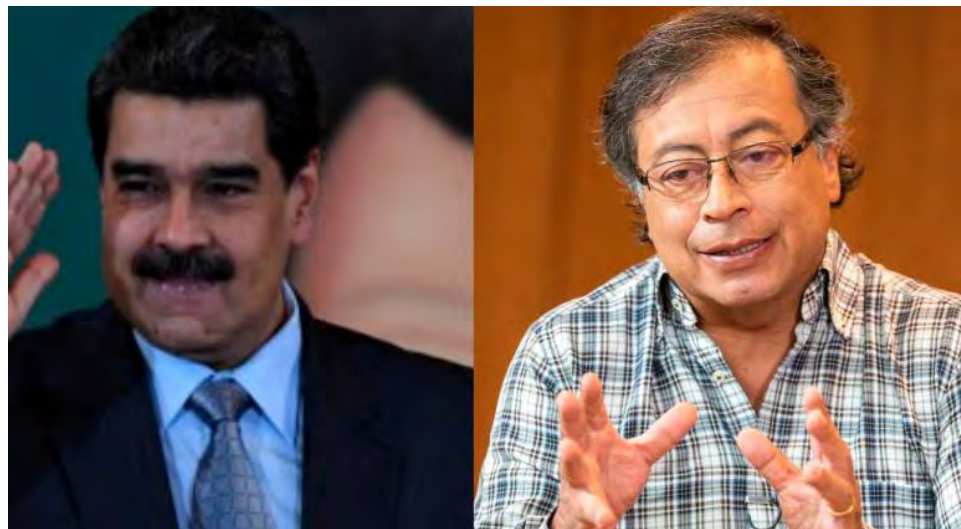
Afinidad política une a Maduro y Petro para volver a unir lazos entre los dos países.

Tras el anuncio de Petro, presidente de Venezuela, Nicolás Maduro, confirmó que mantuvo una charla con el mandatario electo de Colombia sobre el tema. “Conversé con el presidente electo de Colombia @petrogustavo, y en nombre del pueblo venezolano, lo felicité por su victoria. Dialogamos sobre la disposición de restablecer la normalidad en las fronteras, diversos temas sobre la Paz y el futuro próspero de am-