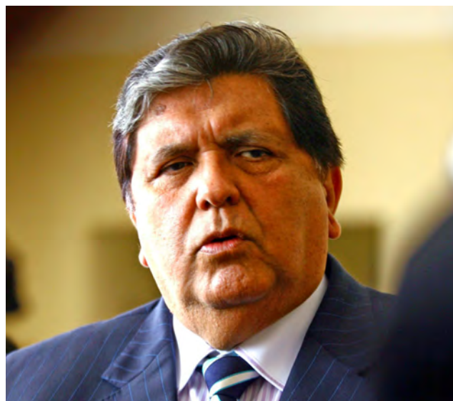
Extraña demora del Poder Judicial retrasa las investigaciones sobre el entorno de García.

De acuerdo a la publicación, el despacho del fiscal José Domingo Pérez viene cursando desde abril pasado diversos pedidos al magistrado del Sexto. Según pudo conocer Sudaca, desde abril el despacho del fiscal José Domingo Pérez viene cursando pedidos al magistrado Pillaca para que se pronuncie, sin lograr que este atienda los