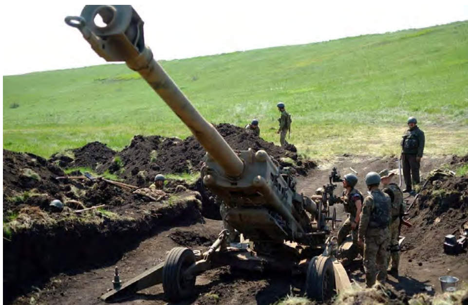
Según Rusia solo le quedan 10 cañones M777 operativos a Ucrania

“Un sistema de defensa aérea enemigo, una estación de radar y vehículos de transporte,