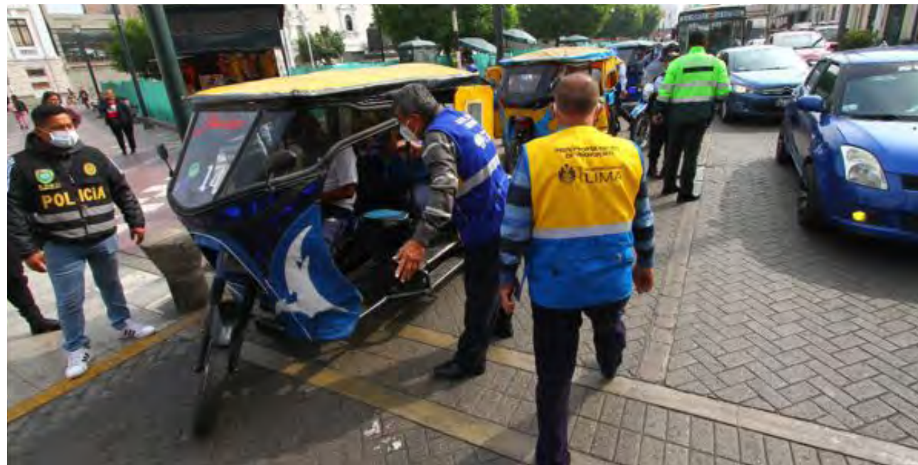
Municipio de Lima indicó que operativos continuarán.

Municipalidad de Lima multa a más de 2,000 mototaxistas informales y advierte que muchos trabajan sin SOAT. Vehículos son usados para robar.