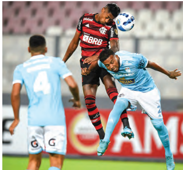
La tiene muy complicada el equipo rimense.

Cristal suma 2 puntos y marcha último en la tabla. El premio consuelo se daría si derrota a Flamengo en Brasil y que la Universidad Católica caiga de local ante el débil Talleres. El equipo brasileño apenas marcha en la décima cuarta posición en el Brasileirão. No es de los mejores, pero considerando la historia de los equipos nacionales cada vez que debe en-