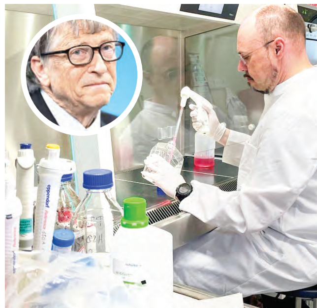
Las infecciones amenazan la salud mundial otra vez.

Sugirió que países como Reino Unido o Estados Unidos inviertan en financiar investigaciones para tratar estos próximos virus que llegarán, también deberíamos "hacer que las vacunas sean baratas, tener grandes fábricas, erradicar la gripe,