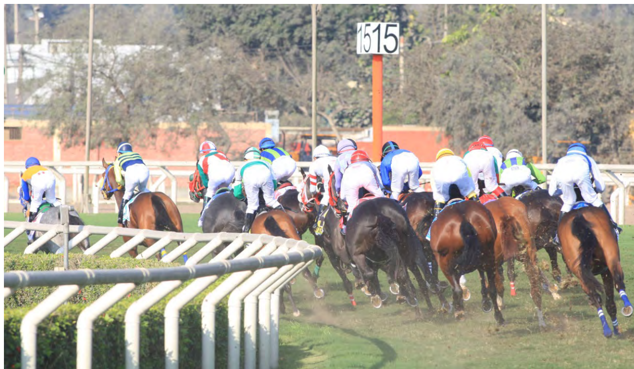
Las yeguas del Pamplona buscarán un cupo para viajar a Estados Unidos

Los mejores caballos en la pista y premios para los aficionados que asistan al hipódromo.