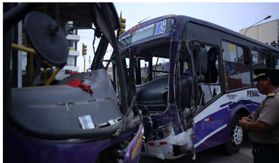
Cuatro menores resultaron heridos en la volcadura.

policontusos, dentro de los cuales se encuentran tres menores de edad. Ellos ya han sido trasladados a los distintos nosocomios de Lima”, añadió.