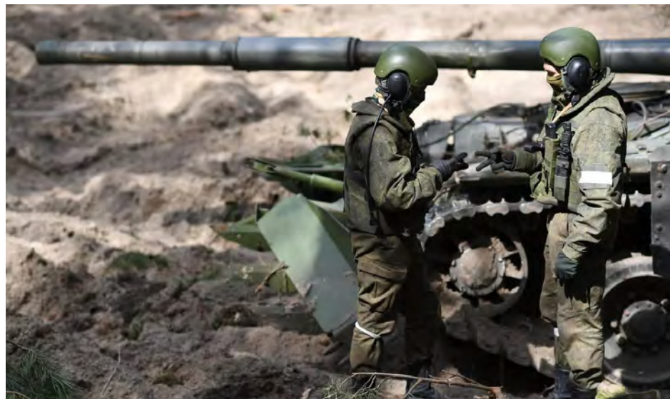
Un cañón ruso apunta a la planta Azot.