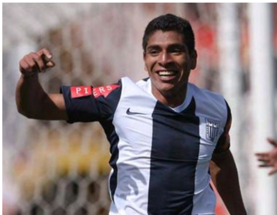
Hurtado tiene 31 años y está valorizado en 400 mil euros.

tado como Guerrero pasen estrictos exámenes médicos para que no le ocurra lo mismo que con Jefferson Farfán que sigue sin debutar todo el 2022.