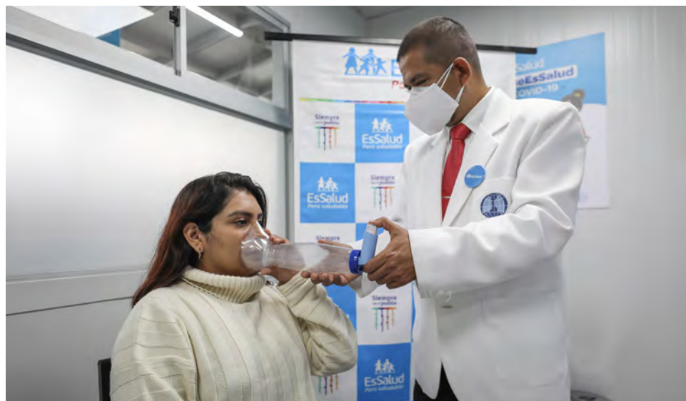
A abrigarse recomendó Essalud.

Con el descenso y los cambios bruscos de la temperatura, las infecciones respiratorias agudas (IRA) se están incrementando mes a mes en todo el país y la Oficina de inteligencia y