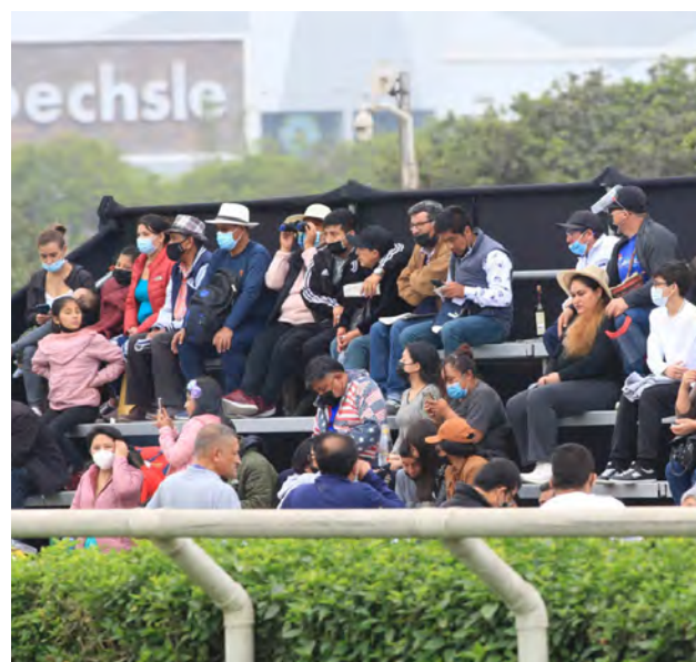
La zona de La Pelousse estará muy concurrida.

El domingo es el día y las puertas de Monterrico estarán abiertas desde el mediodía y con una invitación que se traduce en dividendos. La administración del Hipódromo informó que las primeras cien personas que asistan a las instalaciones recibirán un vale de 20 soles para apuestas, así que es otro motivo para no perderse esta fiesta hípica.