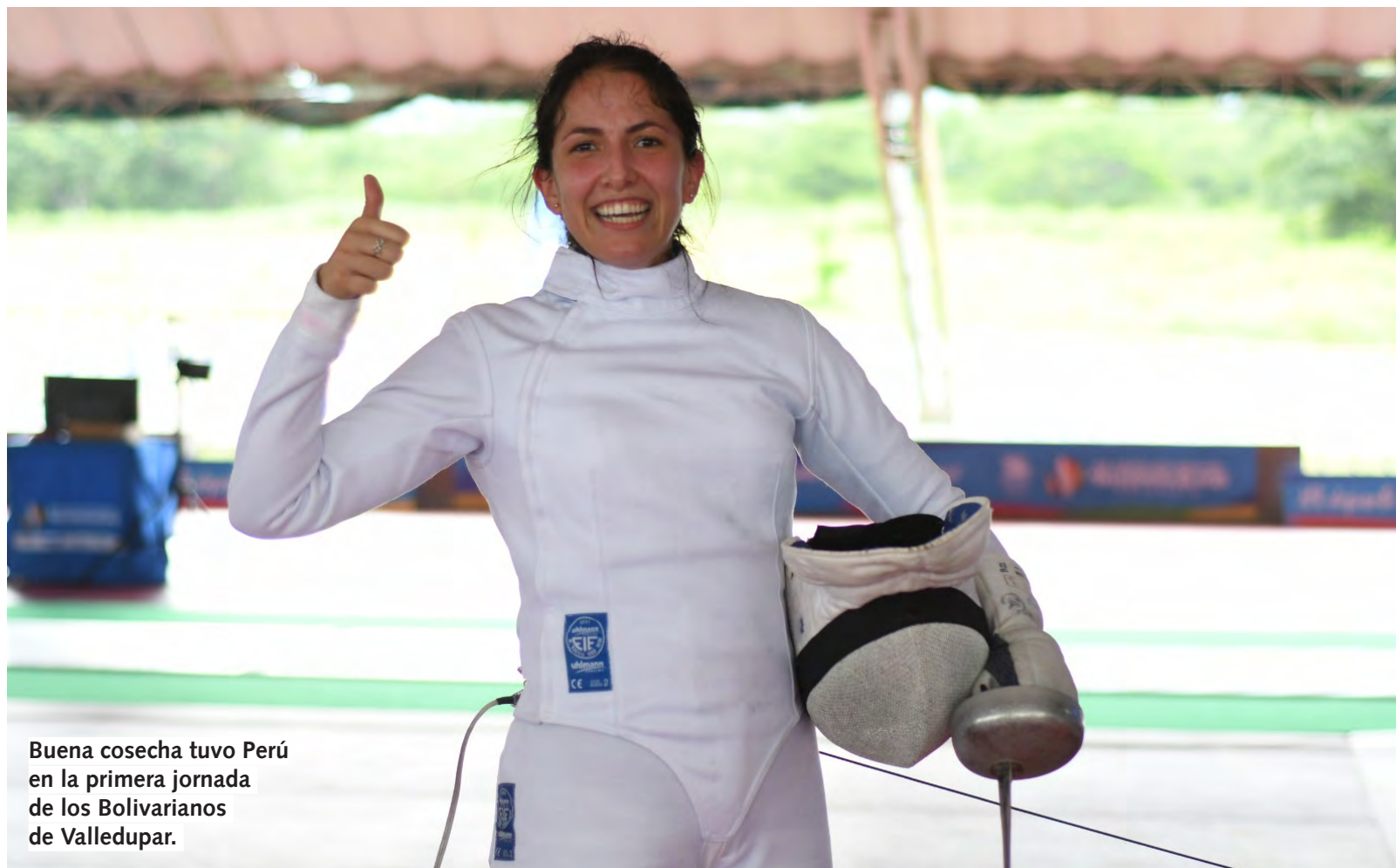
Buena cosecha tuvo Perú en la primera jornada de los Bolivarianos de Valledupar.

livarianos Santa Marta 2017, en Colombia, los exponentes peruanos lograron la cuarta posición con Ecuador. Perú ganó 32 medallas de oro, 53 de plata y 69 de bronce con un total de 154 medallas.