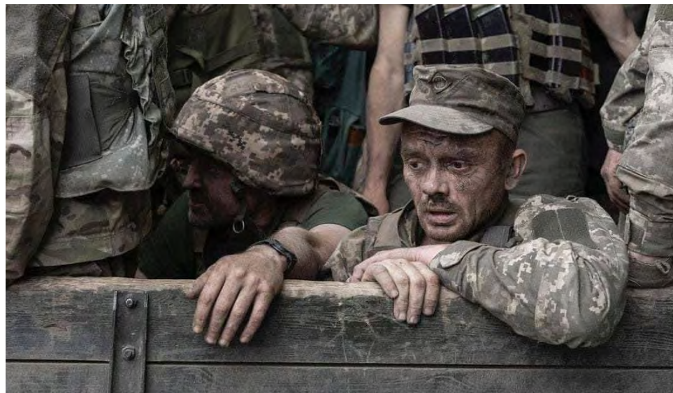
Mientras avanzan los rusos toman más prisioneros.

Tras dos semanas de lucha, los restos del ejército ucraniano que defendían Severodonetsk, atrincherados en la planta de Azot abandonaron el lugar en una operación silenciosa. El alcalde de la