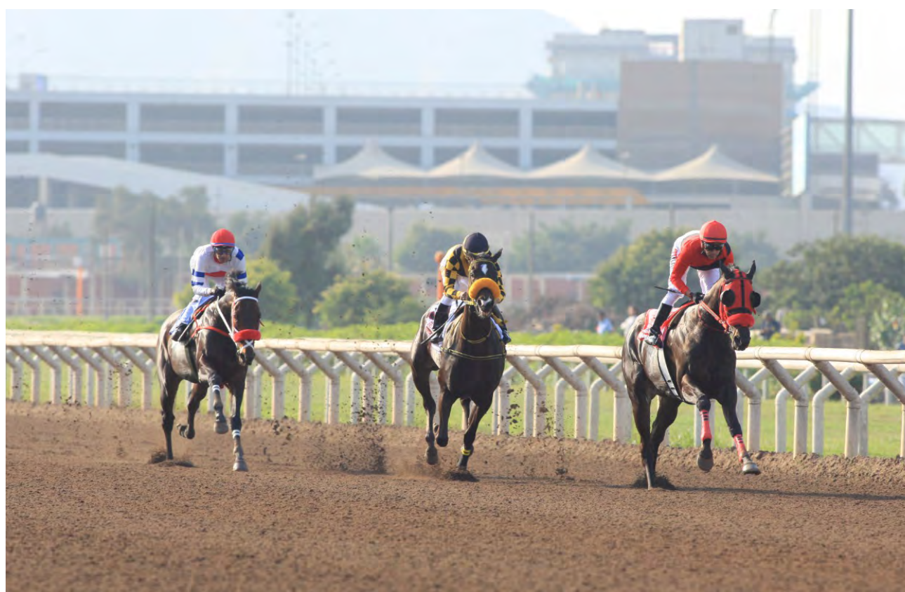
Encuentro de campeones en la pista

Los mejores fondistas por la milla y media del Jockey Club del Perú (G1)