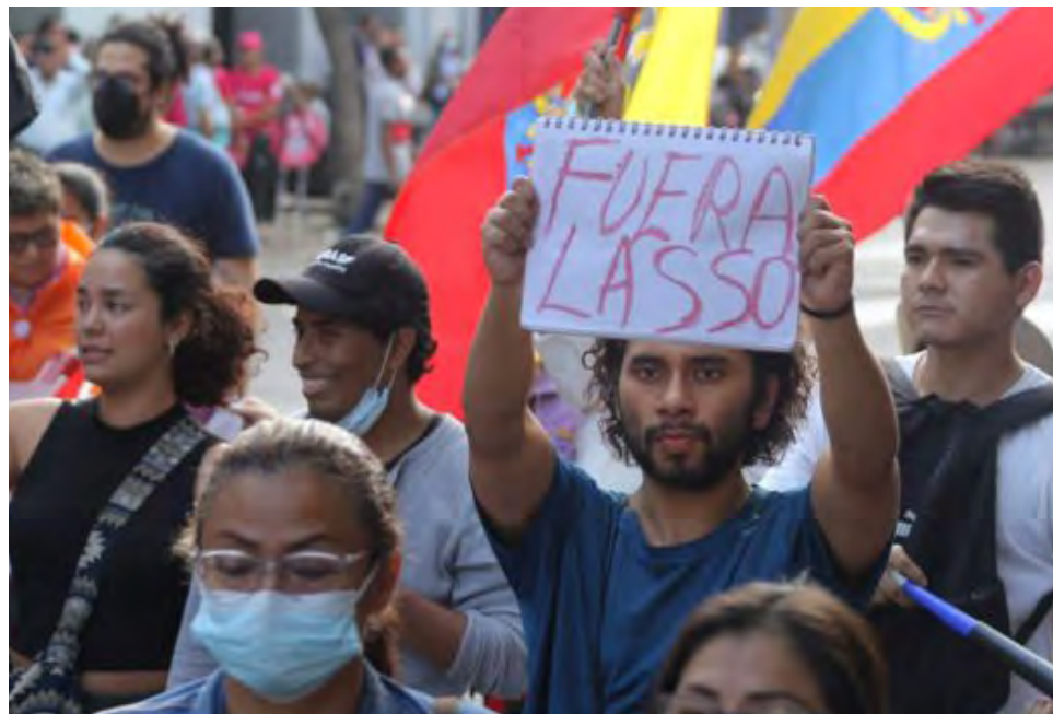
Las protestas parecen querer la dimisión del presidente.

La posibilidad de un diálogo inmediato se diluyó. Tras el gesto del Gobierno de conceder la entrada de los miembros de la Confederación de Nacionalidades Indígenas del Ecuador (Conaie), no hubo un gesto similar