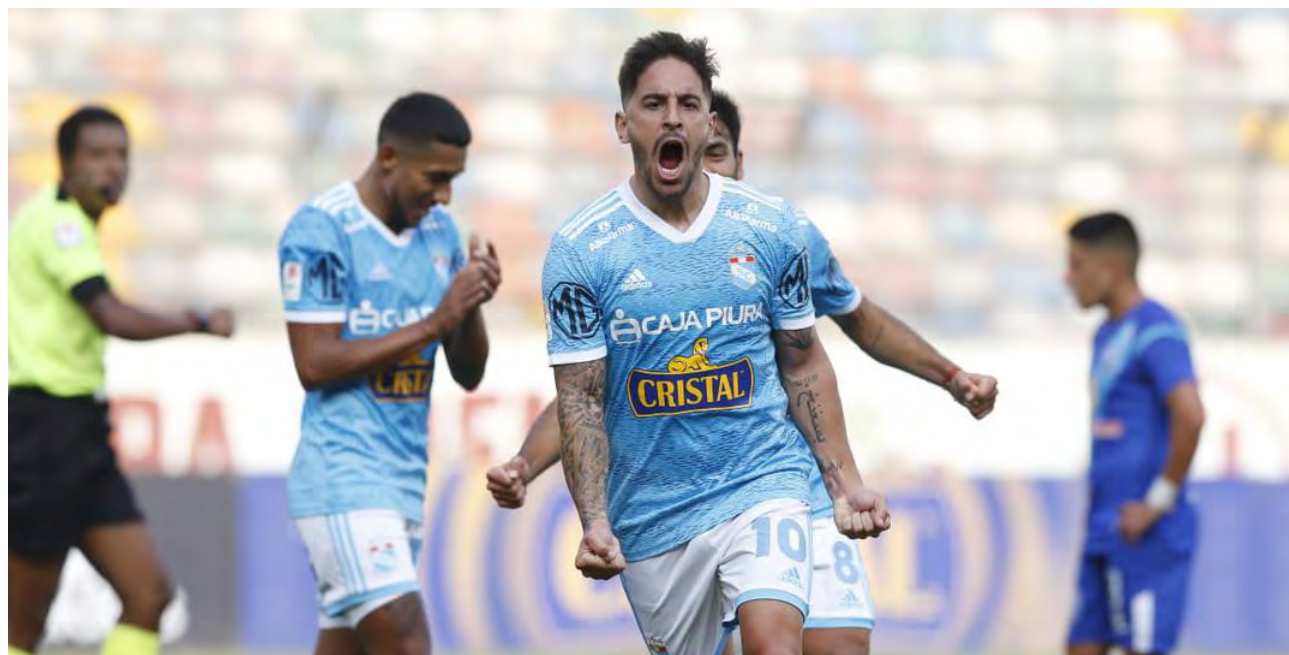
Hohberg anotó el gol, que de poco valió en el objetivo de pelear el Apertura.

fecha de terminar el primer torneo del año. Fue el único partido de ayer por la penúltima fecha