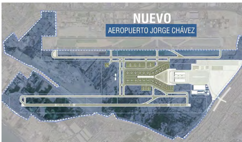
Así ofrecía la maqueta de la segunda pista el concesionario LAP.

“En el caso de que los avances tecnológicos existentes al momento en que deba iniciarse la construcción de la segunda pista hagan inútil o parcialmente inútil, la construcción de la misma, el Concedente contando, previamente, con la opinión técnica de OSITRAN podrá modificar o sustituir la obligación del Concesionario de construir la segunda pista. Esta facultad es exclusiva del Concedente y deberá ser ejercida a más