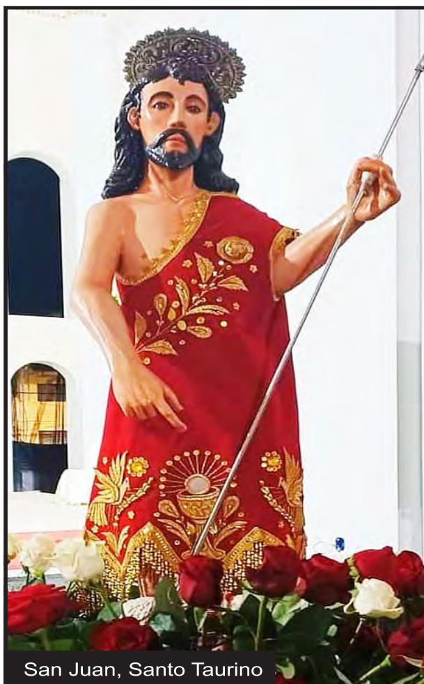
San Juan, Santo Taurino

Hace décadas, rondando los años cincuenta, la carretera que interconectaba los pueblos de las provincias norteñas de la sierra cajamarquina, con