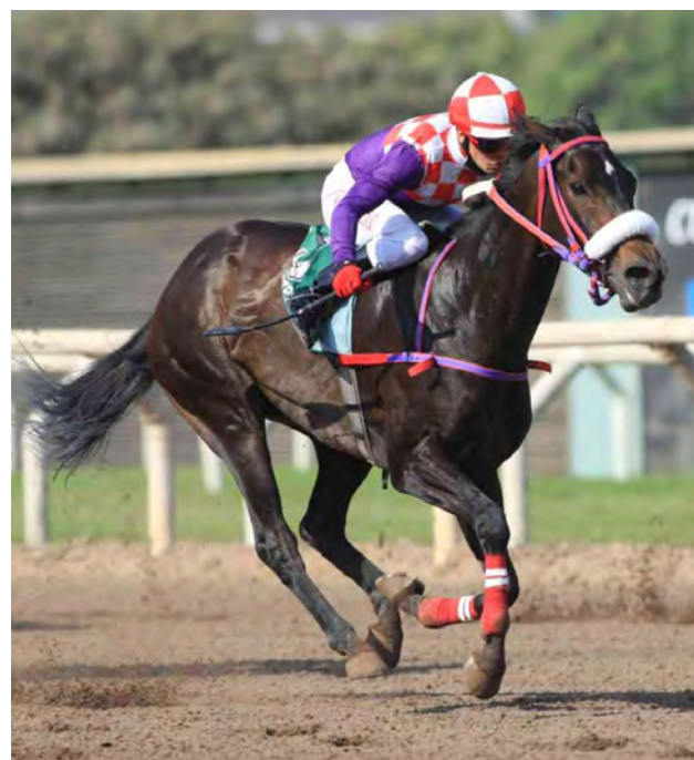
La yegua del Pope puede abrir la cuádruple con Mariano Arenas.

En la milla del OSAF, Eliitas es amplio favorito. El argentino del Jet Set por permanece imbatible en lo que va de temporada. Asoma Rainbow Danny como una carta de peligro, pues un caballo que marcha de seis actuaciones para saldo de cuatro años victorias, hay