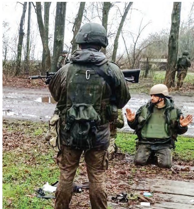
Militares ucranianos se rinden por falta de municiones y comida en el Dombass.

El medio Primavera Rusa mostró un interrogatorio a un prisionero ucraniano en la que releva que su unidad tenía unos 100 efectivos. Comenzaron a luchar, pero solo tenían ametralladoras y pocos misiles