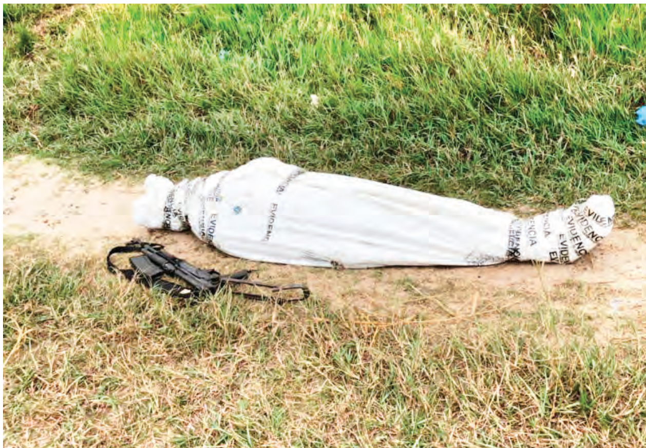
La policía entregó esta foto en la que se ve a un hombre cubierto, sin rostro.

Prófugo le arrojó una granada aun comando policial. Se había escapado hace dos meses de la cárcel