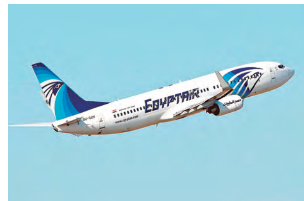
Podría haber una demanda penal.

había sido derribado en un ataque terrorista. La investigación fue hecha por la Oficina de Investigación y Análisis para la Seguridad de la Aviación Civil (BEA) de Francia.