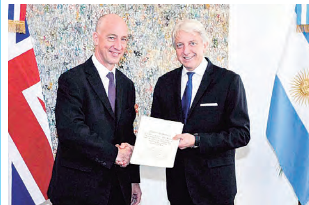
“Amigos” con un par de tragos.

El exministro de Asuntos Exteriores del Reino Unido para las Américas, Alan Duncan, desató un escándalo al revelar en sus memorias que el exsecretario de Relaciones Exteriores de Argentina, Carlos Foradori, firmó un acuerdo sobre las Islas Malvinas en estado de ebriedad en 2016.