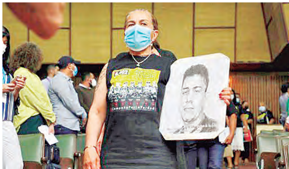
Fue el turno de escuchar a las madres de los desaparecidos.

Los canales en Telegram ucranianos, ‘Ukraina v shoke’, ‘Ukraina novosti’, y ‘Ukraine news’ que cuentan con cientos de miles de seguidores y promueven el punto de vista de Kiev, publicaron recientemente fotos de supuestos niños albergados en un sótano en la ciudad de Járkov debido al actual conflicto.