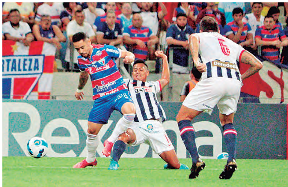
Alianza suma 27 partido sin ganar en la Copa.