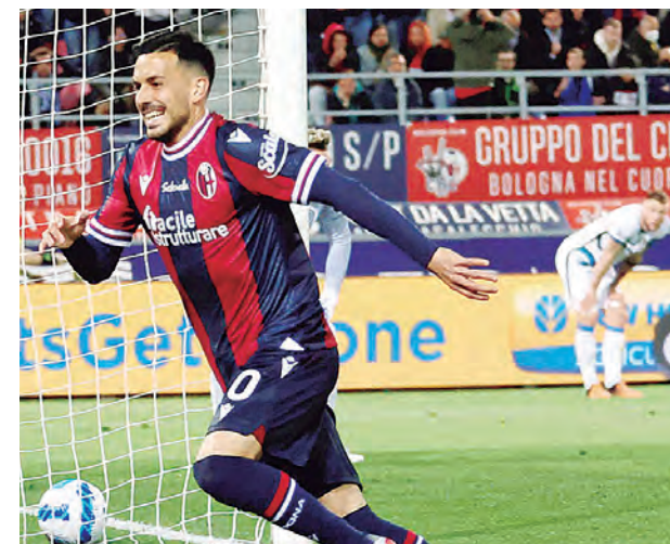
Los interistas no pudieron alcanzar la punta.

El partido fue pospuesto en enero debido a un brote de coronavirus en el plantel de Bologna. En otros partidos de ayer, Atalanta y Torino empataron 4-4, mientras que Udinese goleó a domicilio a la Fiorentina 4-0.