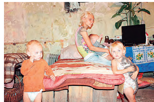
La foto en mención.

No se descarta que los atentados sean obra del ejército ucraniano o de sus aliados para impedir un futuro “puente” con Rusia a través de la parte sur de Ucrania o que sean también los mismos rusos para permitir una intervención de “seguridad” en Transnistria.