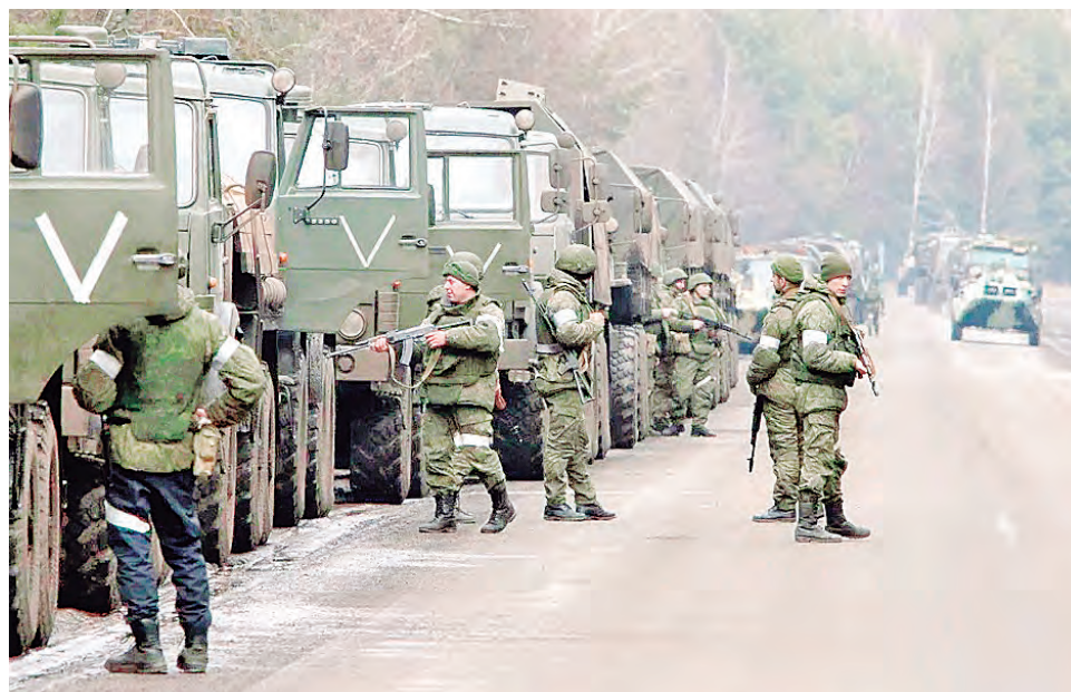
Tropas rusas siguen avanzando en el Este.

Las fuerzas armadas de Ucrania reconocieron la pérdida de varios pueblos y aldeas en las regiones orientales del país a medida que Rusia intensifica su ofensiva terrestre. “Desde el norte, las unidades rusas están atacando en dirección a Barkinove, un pueblo al sur de Iziium,