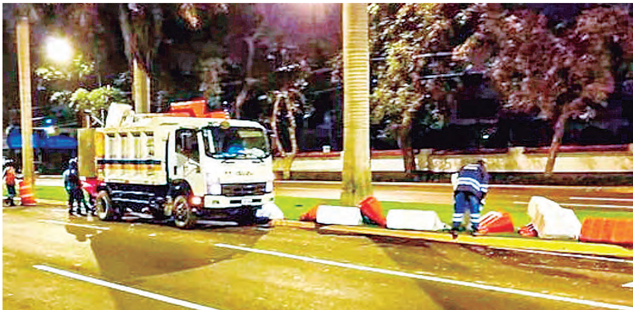
El tráfico siempre ha sido un problema en la Av. Javier Prado.

La Autoridad de Transporte Urbano para Lima y Callao (ATU) denunció que la Municipalidad Metropolitana de Lima retiró sin ningún motivo un total de 778 separadores viales (también conocidos como jersey's),