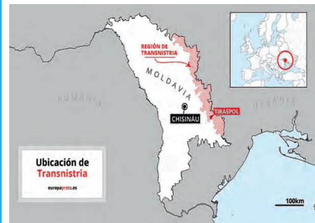
Transnistria denuncia disparos desde Ucrania.

Desde que un grupo armado atacó con lanzagranadas la sede del gobierno de la autoproclamada república de Transnistria, ya se produjeron tres ataques más sin que ningún grupo reclamara su autoría. Ayer las fuerzas de seguridad de la región separatista de Moldavia, repelió un asalto a un depósito de municiones.