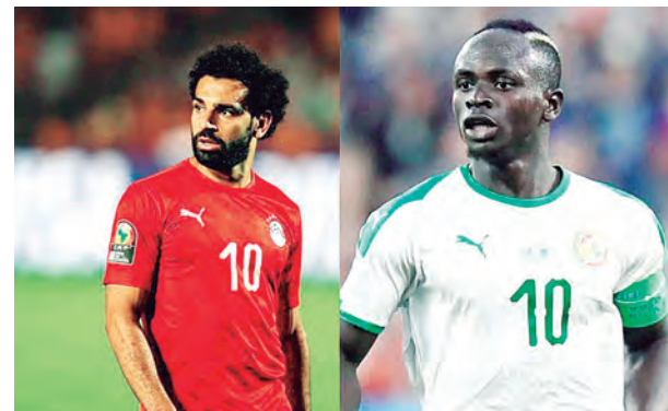
Son de los mejores jugadores del mundo.

El partido de ida en El Cairo vio ganador a Egipto 1-0 sobre Senegal. Apenas a los 3 minutos, Salah la estrella del Liverpool remató al arco, el balón se estrelló en el poste y el rebote le cayó a Ciss y se introdujo en su propio arco. Hoy desde las 12:00 hora será la revancha. Solo hace menos de dos meses ambas selecciones se enfrentaron en la final de la Copa de África. El partido quedó 0-0, pero en la definición desde el punto del penal ganó el equipo de Mané 4-2.