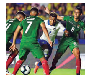
Bolivia debería ganar.

Brasil, líder de las eliminatorias sudamericanas y con el boleto al Mundial de Qatar 2022 asegurado, visitará a Bolivia en el Estadio Hernando Siles de La Paz desde las 18:30 horas. Es probable que la altura de La Paz sea un rival más fuerte que la propia selección altiplánica. No sería extraño que Brasil acumule su primera derrota en este proceso eliminatorio.