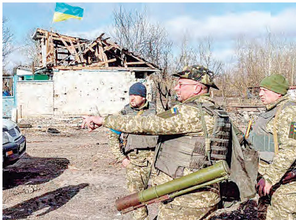
Fuerzas ucranianas volvieron a la ciudad.

“Las fuerzas armadas están avanzando, la policía está avanzando e inmediata-