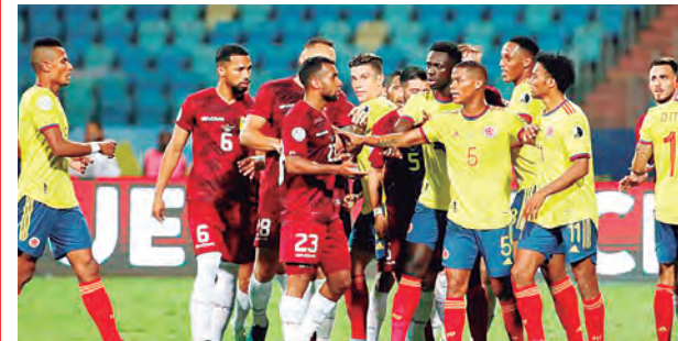
Siempre son partidos con mucha rivalidad.

La selección de Venezuela recibirá a Colombia desde las 18:30 horas en el estadio Cachamay de Puerto Ordaz, tendrá una vez más la oportunidad de 'darle una mano' a Perú en las eliminatorias, tal como sucedió en las pasadas rumbo a Rusia 2018.