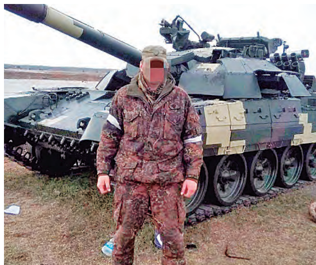
Un tanque ucraniano capturado.

A pesar de que todos los drones se detectaron en diferentes áreas, teniendo en cuenta aproximadamente el mismo momento de