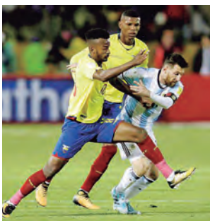
Messi le hizo tres goles.

El próximo partido de Scaloni después de Ecuador será ante Brasil en el partido aplazado y