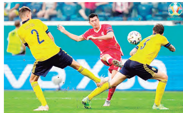
El partido será Lewandowski contra Suecia.

Marruecos con Hakimi y Ziyech apenas pudo empatar con Congo 1-1, aunque tendrá la ventaja de ser local. Algo similar sucedió en el duelo entre Ghana y Nigeria que terminó 0-0 en Acra. En el primero juega Partey del Arsenal y Jordan Ayew, hijo de Adebí Pelé. Mientras que en Nigeria lo hacen las estrellas Osimhen, Chukwueze e Inehacho.