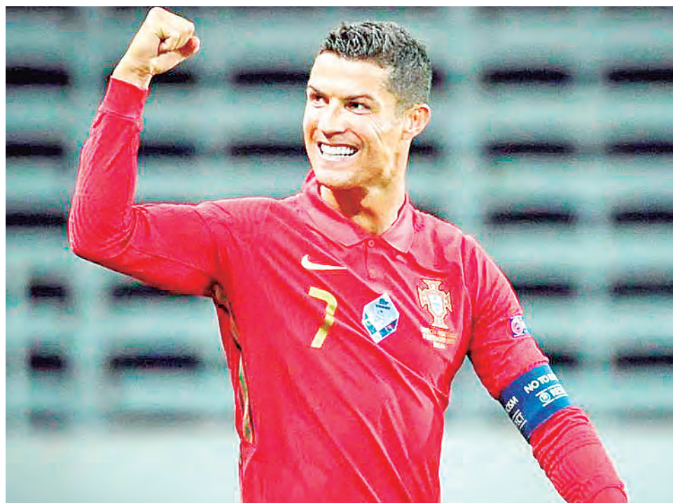
Ronaldo va por su quinto mundial.

El técnico portugués ha recuperado a los defensores Cancelo y Pepe. Y alista un sistema de 4-1-3-2, con Ronaldo y Jota como delanteros.