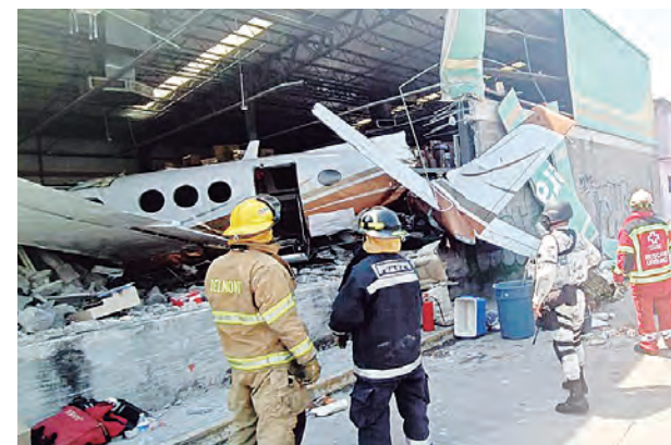
Impresionante accidente aéreo.