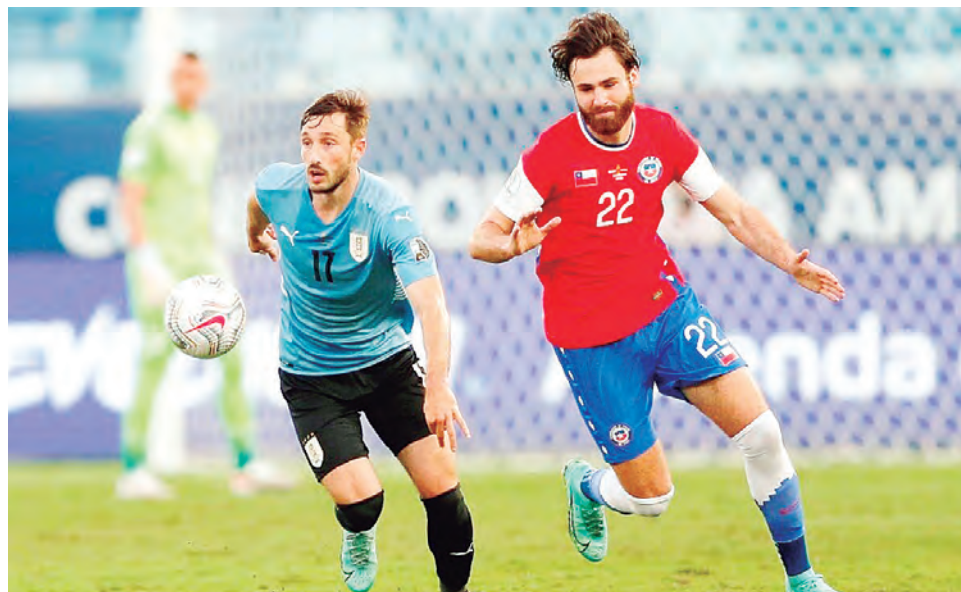
Chile la tiene difícil ante Uruguay.

El partido ante los uruguayos será a partir de las 18:30 horas. Los charrúas tienen la tranquilidad de estar ya clasificados al Qatar 2022