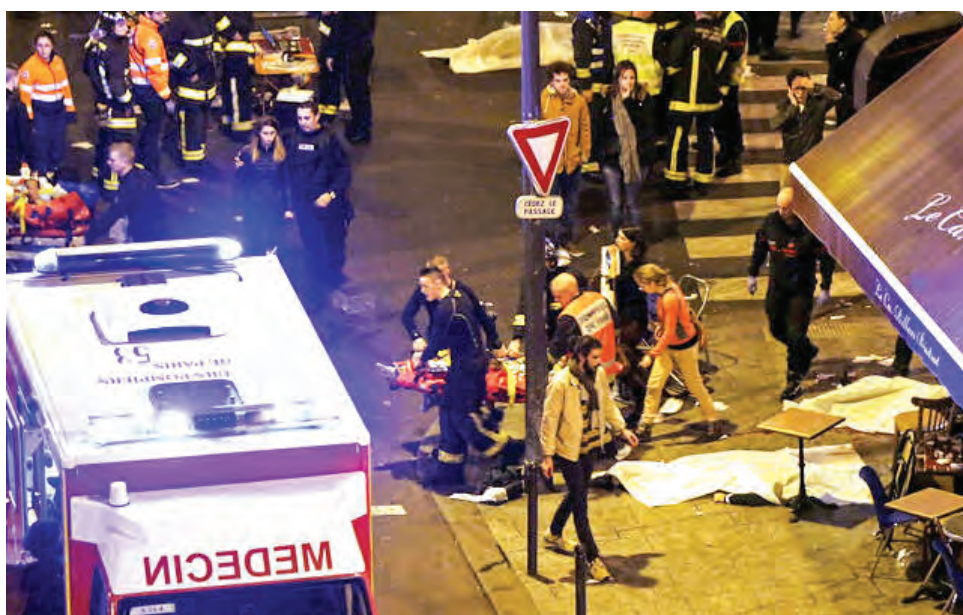
Los atentados costaron la vida de 131 personas.

SALAH ABDESLAM se llevó la mayor pena de los acusados. No reconoció culpabilidad. El juicio duró 10 meses.