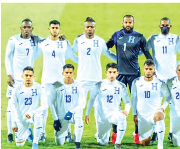
Honduras está en el puesto 80 del ranking FIFA.

Perú ya pactó con México y el partido ante Honduras sería unos días luego. Honduras quedó eliminada del mundial Qatar 2022. Sin embargo está participando en la Liga de la Naciones de la Concacaf. Lleva tres partidos en el grupo C de la Liga A. Todos desarrollados en junio. Venció 1-0 a Curazao de visita, luego cayó de local 1-2 ante el mismo rival. En su últi-