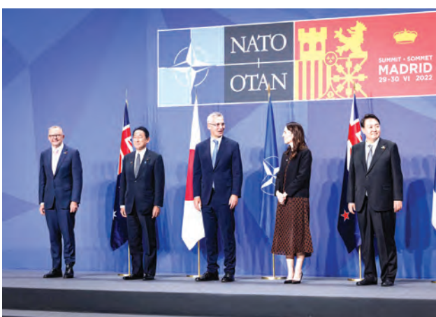
Invitaron a países que son rivales de los chinos.

Lo curiosos de la cumbre es que ni bien comenzó a exponer Stoltenberg se dedicó a mencionar directa o en forma táctica a China, dejando el conflicto ucraniano a un segundo plano, cuando el sentido de la reunión era justamente para respaldar a Kiev en su guerra con Rusia.